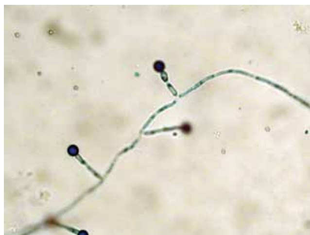
1. ábra | Candida albicans chlamydoconiaképzés kukoricaagaron, agarblokk vizsgálata mikroszkóppal

nálata, vashiány, polycystás ovarium szindróma paramétereit kerestük ki. A diagnózist a meglévő klinikai tünetek mellett a laboratóriumi diagnosztika első lépéseként használt metilénkéssel és/vagy Gram szerint festett hüvelyváladékból készült kenetben kimutatható sarjadzó sejtek és/vagy pseudohyphák jelenlététől függően állítottuk fel. Második lépésben a hüvelyváladék került levételre tenyésztésre, amely Sabouraud chloramphenicol táptalajon, 37 °C-on közönséges termosztátban 48 óráig történt. Az izolált gombatorzs speciesszintű meghatározását Chrom agaron, keményítőtartalmú kukoricaagaron ( 1. ábra ) és cukorbontáson alapuló Auxacolor teszttel végeztük, valamint 2014-ben bevezetésre került a MALDITOF (Matrix Assisted Laser Desorption Ionization Time of Flight) módszerrel történő diagnosztika is.