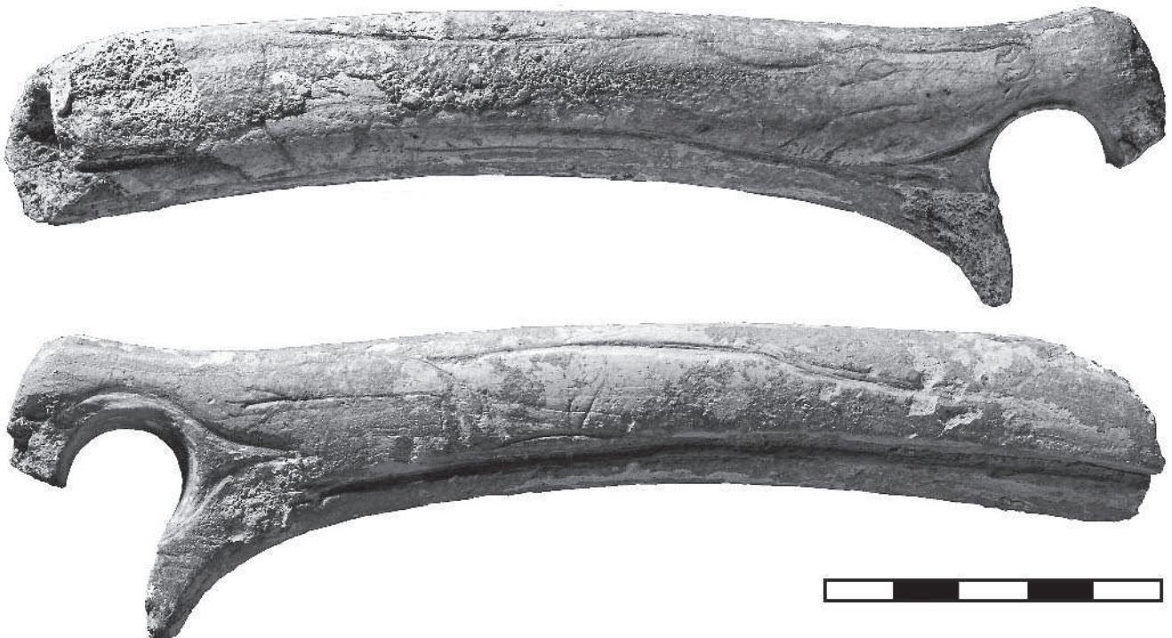
Fig. 1 – Bâton percé (l'orientation de l'objet privilégie la lecture du décor et non les conventions de la typologie osseuse).

Le bâton percé est façonné sur un bois de renne droit, de petit module, provenant d'une femelle ou d'un jeune mâle. La partie utilisée comprend la perche A + B et la