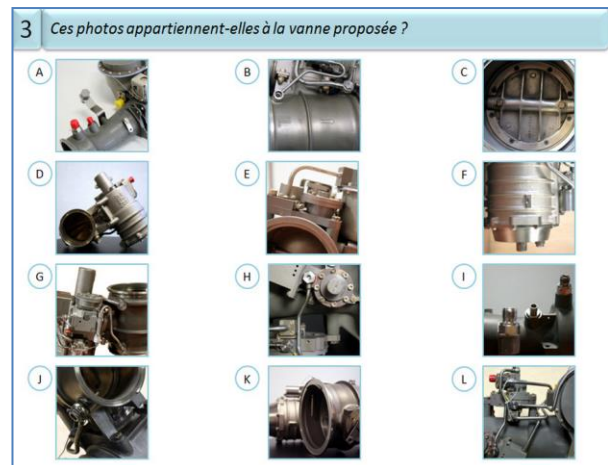
Figure 3 : Écran de consignes - épreuve III