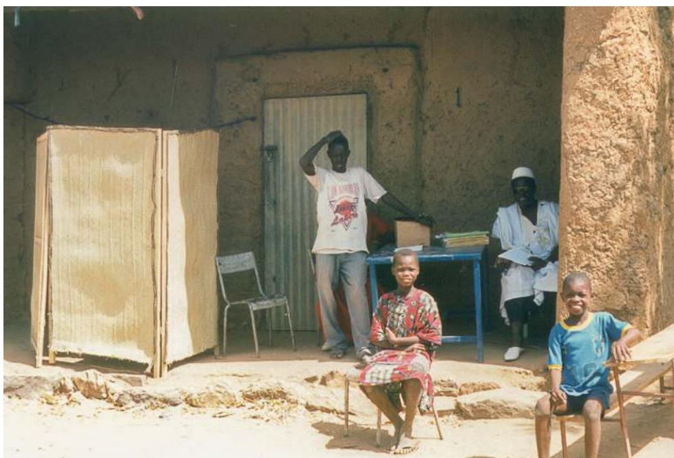
Illustration 2 - Un bureau de vote dans le village de Maréna-Diombougou (région de Kayes) lors des élections législatives de 1997

Les listes électorales n'ont pas été acheminées à temps et le bureau n'a pas pu ouvrir à l'heure prévue. Chaque scrutin représente un défi logistique et humain dans un pays si vaste et enclavé.