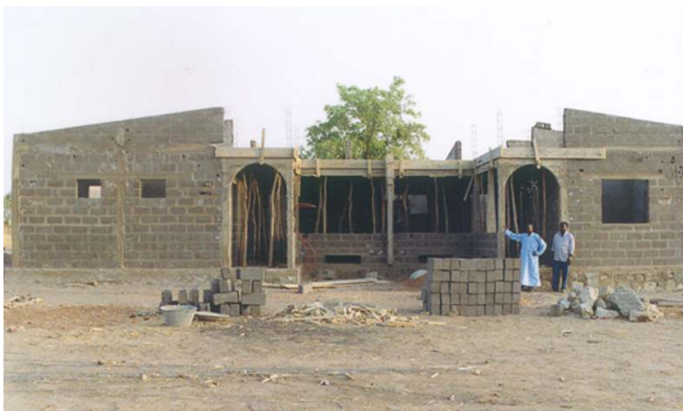
Illustration 5 – Mairie de Diokéli (région de Kayes)

Financée par la coopération allemande. Auteur : S. Lima, 2001.