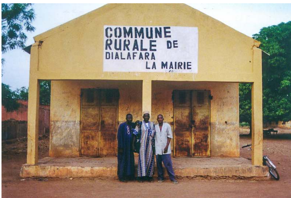
Illustration 6 – Mairie de Dialafara (région de Kayes)

Installé provisoirement dans une coopérative agricole.