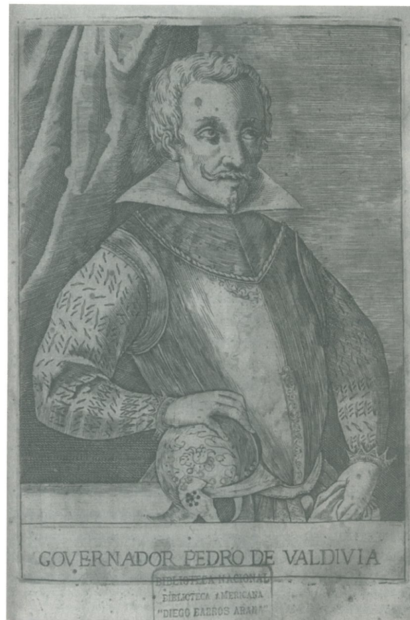
Fig. 1. Retrato del gobernador Pedro de Valdivia, en «Historica relacion del Reyno de Chile», Alonso de Ovalle, 1646.