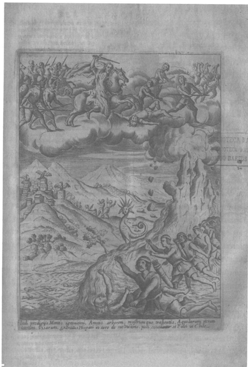
Fig. 3. Hechos milagrosos que precedieron a las paces de Baydes, en «Historica relacion del Reyno de Chile», Alonso de Ovalle, 1646.

Sin embargo, los colonos debían resignarse a vivir en estas nuevas tierras e iniciar procesos de apropiación. Portador a la vez del imaginario medieval y del método humanista, Gerónimo de Vivar es el primer europeo que describe de manera precisa el espacio chileno. Aunque su obra haya permanecido como manuscrito hasta el siglo XX, no deja de ser reveladora y fundacional de imaginarios europeos e hispanoamericanos a propósito de Chile. Lejos de establecer una visión romántica del espacio, Vivar entrega los conocimientos necesarios para la colonización. Se puede medir aquí la capacidad de la Corona de reunir tales informaciones sobre sus territorios recién conquistados –recordemos que la crónica de Vivar circuló aparentemente en el Consejo de Indias—. Espontáneamente, el conquistador Vivar fue capaz de describir de manera rigurosa el espacio chileno. Pensó y organizó el territorio en valles potencialmente habitables, y catalogó los recursos explotables para los futuros colonos. Esta descripción «utilitarista» de Chile se puede poner en relación con toda una bibliografía de promoción del país, prospectos llamando a la emigración y a la colonización. Sabemos que este tipo de representación persistió hasta épocas más recientes 79 .