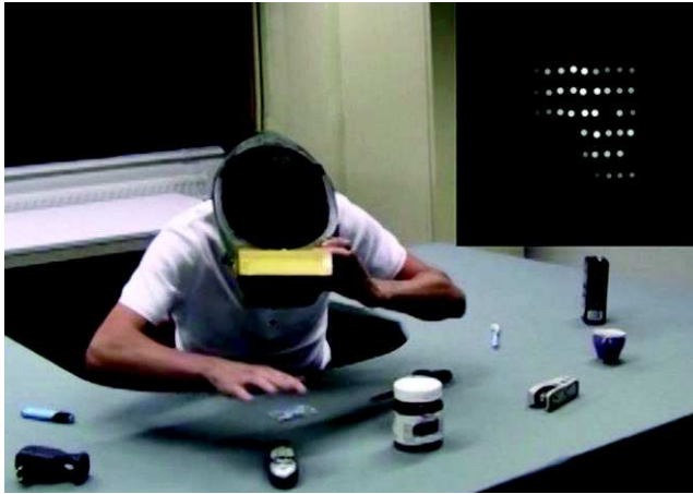
Fig. 4. : Expérience de simulation de neuroprothèse visuelle. Le casque de réalité virtuelle affiche la scène visuelle telle qu'elle serait perçue par une personne non-voyante implantée avec une neuroprothèse visuelle (image en haut à droite). La tâche à effectuer consiste ici à saisir un objet précis sur la table.

l'ANR), les établissements, les collectivités locales, etc. Ces durées ne dépassent généralement pas 4-5 ans après lesquels le consortium se dissout. Les partenaires partent alors de façon isolée ou fragmentée vers de nouveaux projets. Par conséquent, certaines recherches ne sont ni poursuivies, ni transférées vers l'industrie.