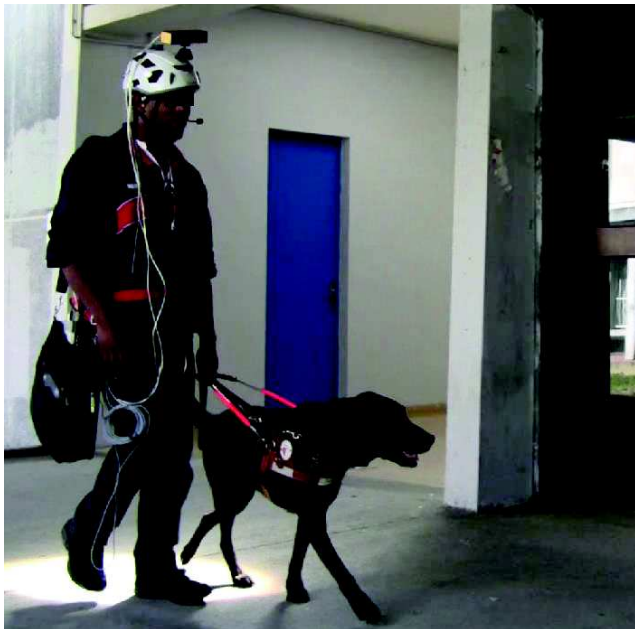
Fig. 1. Prototype de laboratoire du dispositif NAVIG incluant un GPS, des centrales inertielles, des caméras embarquées, ainsi qu'une interface utilisateur adaptée aux déficients visuels (reconnaissance de parole et synthèse de parole ou de sons 3D par conduction osseuse). Le guidage et la description de l'espace sont réalisés en augmentant l'environnement avec du texte et/ou des sons spatialisés.

Le projet a abouti à la conception et l'évaluation d'un prototype de laboratoire (voir Fig. 1). Il a permis de faire des progrès significatifs dans des domaines variés appartenant aux sciences cognitives (représentations spatiales chez les déficients visuels, perception auditive 3D, modélisation de la vision), et à l'IHM (interaction non-visuelle, interaction en mobilité, technologie d'assistance) (voir [2], [3]). Ces objectifs de recherche fondamentale formulés par les laboratoires étaient accompagnés de la volonté d'augmenter l'expertise et la compétitivité des deux PME participantes, notamment en aboutissant à des innovations en vision artificielle embarquée, en géolocalisation du piéton et en technologies de guidage pour les déficients visuels. Ces innovations ont été appliquées dans les domaines des technologies d'assistance pour les déficients visuels évidemment, mais aussi dans des domaines d'activité différents (navigation autonome de véhicules intelligents, navigation pour piétons, robotique, etc.).