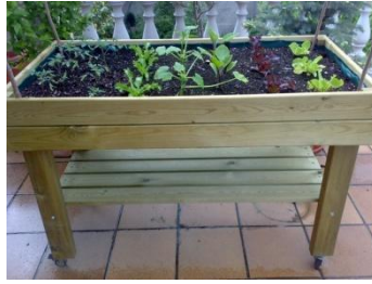
Imatge d'una taula de cultiu 4