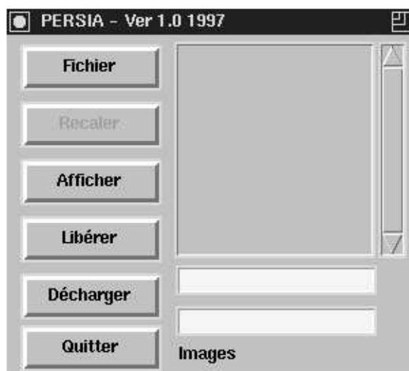
FIG. 1.1 – Menu Principal de PERSIA

Une fois les fichiers installés, le programme peut être lancé par la commande: persia . Cette commande affiche automatiquement le menu principal du logiciel (voir FIG. 1.1).