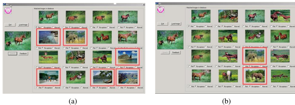
Figure 1. (a) Les seize premiers résultats sans retour de pertinence, les images en rouge sont les images non pertinentes, les autres sont pertinentes (b) Les seize premiers résultats quand on fait une fois le retour de pertinence

Pour comparer les résultats avec notre interface graphique 2D, nous avons développé une interface traditionnelle (fig. 1.a). La méthode de retour de pertinence [RUI 98] a été appliquée. Dans cette interface, l'image requête est à gauche, les seize premières images résultats sont affichées à droite, sous chaque image résultat, on a trois options à choisir (pertinente, neutre, non-pertinente) pour faire le retour de pertinence. Avec la méthode de Rui, les deux descripteurs utilisés sont la couleur et la texture (quatre représentations utilisées pour la couleur : l'histogramme [SWA 91](RVB et TSV), les moments [STR 95](RVB et TSV) et une représentation utilisée pour la texture : les matrices de co-occurrences [HAR 73]). La figure 1 montre un résultat de cette méthode avec l'interface traditionnelle. Dans cet exemple, l'utilisateur veut chercher des images contenant un (des) cheval (chevaux). L'image (a) montre les seize premiers résultats, les images en rouge sont les images non pertinentes, les autres sont pertinentes. L'image (b) montre les seize premiers résultats quand on fait une fois le retour de pertinence. Le nombre d'images non-pertinentes diminue et leurs rangs sont beaucoup plus élevés (pertinence faible) que ceux des images pertinentes (premiers rangs).