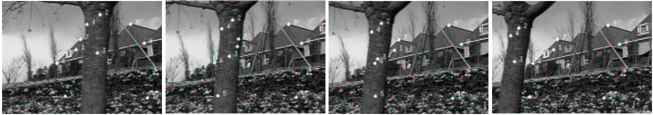
points initiaux sur l'image # 0