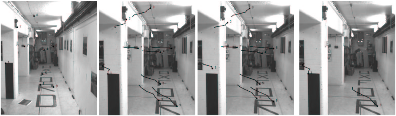
points initiaux sur l'image # 0 Filtre linéaire conditionnel (# 6) Méthode différentielle robuste (# 6) Méthode de Shi-Tomasi-Kanade (# 6)