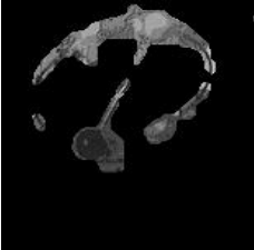
carte de mouvement secondaire