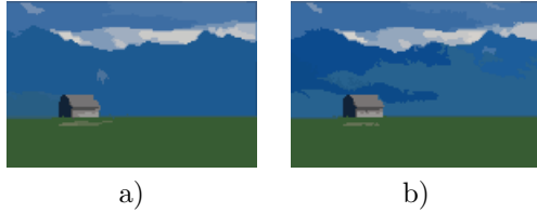
FIG. 2 – Résultats de classification mean shift avec l’estimateur balloon sur l’image d’un chalet pour a) l’algorithme de sélection de la section 2 et b) notre algorithme itératif.