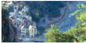
FIG. 3 – Image d’un village.