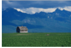
FIG. 1 – Image d’un chalet.