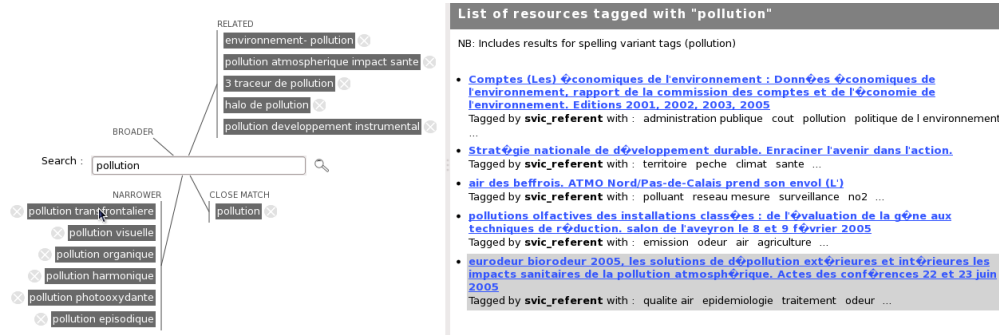
FIG. 2 – Copie d’écran de l’interface intégrant des fonctionnalités d’édition de relations sémantiques (partie gauche) dans un outil de navigation dans la folksonomie (partie droite où les ressources associées au tag cherché, ici “pollution”, sont affichées).

L’interface de navigation dans la folksonomie est présentée figure 2. Dans la partie gauche est située la barre de recherche et les tags suggérés sont répartis dans 4 zones différentes selon le type de relation qu’ils partagent avec le tag cherché. Les ressources associées au tag cherché ainsi qu’aux tags équivalents ( close match ) sont affichés dans la partie droite. L’utilisateur peut ensuite rejeter une relation entre le tag cherché et un tag suggéré en cliquant sur la croix située à côté de chaque tag suggéré. Il est également possible de modifier une relation par une action de cliquer-déposer en déplaçant un tag d’une zone à une des 3 autres zones. Ces manipulations restent donc optionnelles et l’utilisateur peut les ignorer et utiliser uniquement les fonctionnalités de recherche. Chaque utilisateur peut ainsi structurer les relations sémantiques entre tags selon son propre point de vue. Cependant, des incohérences entre points de vue peuvent apparaître et sont détectées et traitées par un autre module que nous décrivons ci-après.