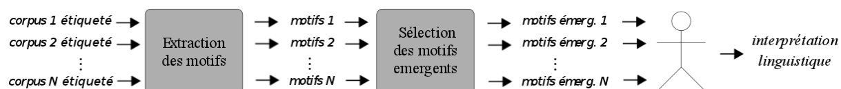
Figure 1: Vue générale de notre approche

La figure 1 illustre les différentes étapes de notre approche.