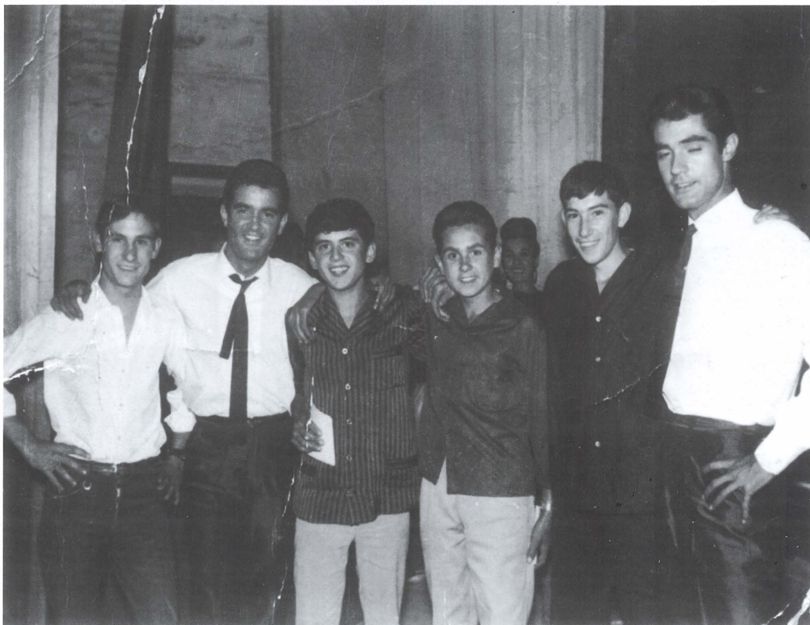
Arxius de Miguel Miró Ferré