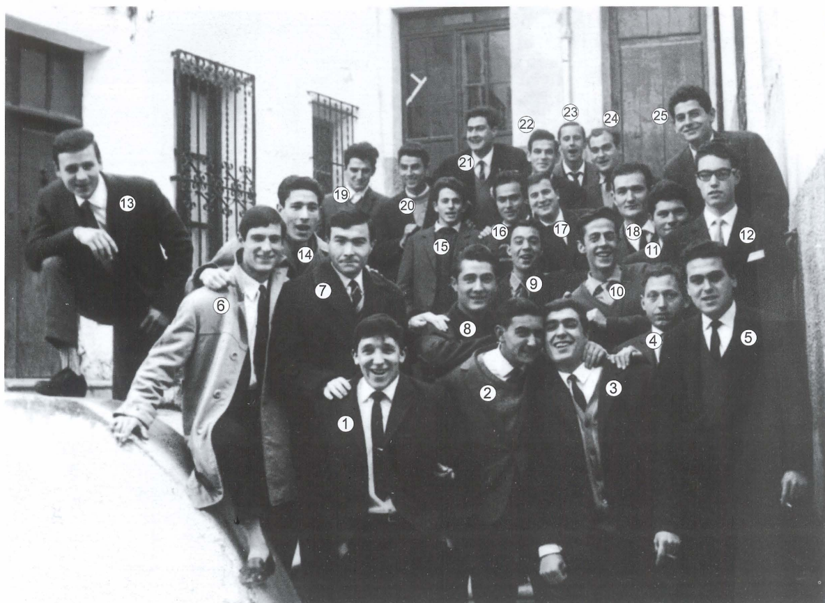
Dia de l'allistament dels components de la quinta de 1966, nascuts l'any 1945.