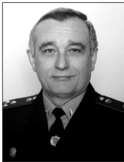
Фото 6. Євген Дмитрович Лук'янчиков

Доктор юридичних наук, професор Євген Дмитрович Лук'янчиков очолював кафедру криміналістики Української академії внутрішніх справ упродовж 1985—1993 рр.