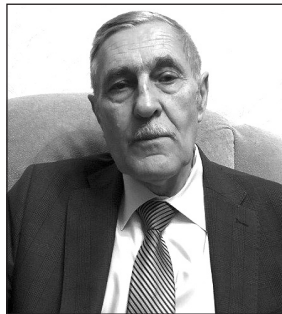
Фото 9. Валерій Георгійович Хахановський

Розробку криміналістичного забезпечення протидії кіберзлочинності в НАВС здійснює наукова школа професора Валерія Георгійовича Хахановського, учня професора А. В. Іщенка.