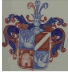
arma Veszelka (Weszelka)

Levéltárak/Archives: Szegedi Levéltár/Archives; Österreichisches Staatsarchiv-Kriegsarchiv.