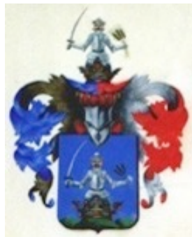
arma Fényes de Csokaly