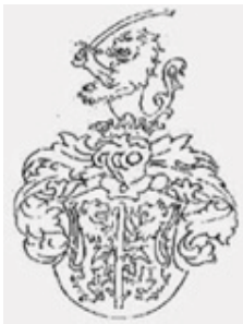
arma Tötössy de Egyházasfalva et Bástifalu