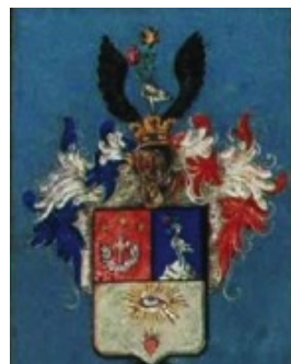
arma Scitovszky de Nagykér genealogia Scitovszky de Nagykér

Borovszky Samu, ed. Magyarország vármegyéi és városai. Magyarország monográfiája. Budapest: Apolló, 1896-1913. Nógrád megye 618. Fröhlichsthal, Georg Freiherr von. Der Adel der Habsburgermonarchie im 19. und 20. Jahrhundert. Inzingen bei Rotherburg ob der Tauber: Bauer & Raspe, 2008. 303. Kempelen, Béla. Magyar nemes családok. Budapest: Grill, 1911-1932. Vol. 9, 297. Nagy, Iván. Magyarország családai czimerekkel és nemzedékrendi táblákkal. Pest, 1857-1868. Vol. 10, 111. Vajay, Szabolcs. A máltai lovagrend magyar lovagjai 1530-2000. Budapest: Magyar Máltai Lovagok Szövetsége, 2002. Vol 1, 151; Vol. 2, 594-95.