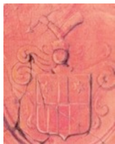
arma Bakay (Bakalovich)