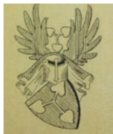
arma Kawka de Ržiczan