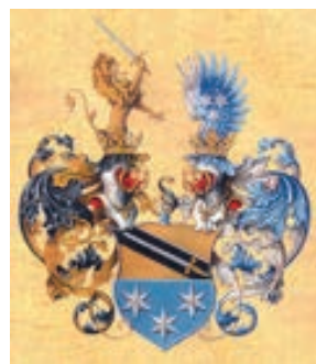
arma Fricke de Sővényháza

Kempelen, Béla. Magyar nemes családok . Budapest: Grill, 1911-1932. Pótlék (Appendix) 328.