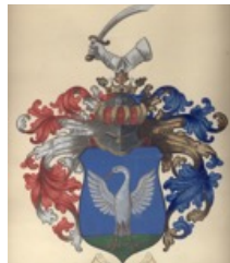
arma Szalay de Eöts

Telesi de Szék & Szalay de Eöts. Nobilitas (2007): 172.