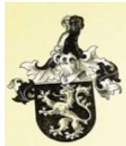
arma Plávenszky de Plavno