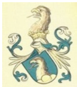
arma Marsovszky de Jablonfalva et Marsófalva