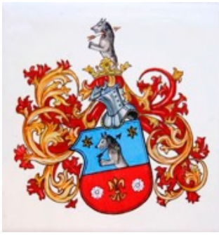
arma Sárközy de Nadasd