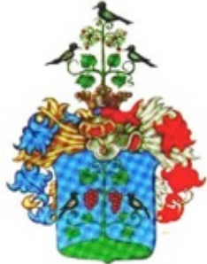
arma Seregély de Nagyemőke