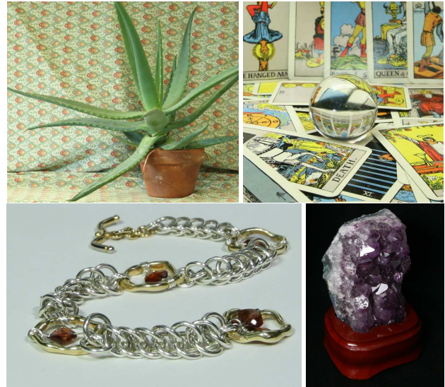
FIGURE 2 – De gauche à droite : l’image “ aloe ” du jeux de données [6], puis “ tarot ”, “ bracelet ” et “ amethyst ” du jeux de données [14].

Pour comparer les résultats obtenus avec la vérité terrain, nous avons utilisé deux mesures de l’état de l’art. Le “ Peak Signal to Noise Ratio ” (PSNR), exprimé en dB, est largement utilisé dans la littérature. Plus le PSNR est grand, meilleur est le signal. Sa valeur est représentative de la qualité du signal mais ne peut pas être considérée comme une mesure objective de la qualité visuelle d’une image, puisque le calcul se fait pixel à pixel. La mesure “ Structural SIMilarity ” [15] (SSIM) a été développée pour mesurer la similarité de structure entre deux images. L’hypothèse est que l’œil humain est plus sensible aux changements dans la structure de l’image, plutôt qu’à une différence pixel à pixel. Pour évaluer nos expériences nous utilisons une distance basée sur la SSIM : DSSIM = \frac{1-SSIM}{2} . Sa ma-