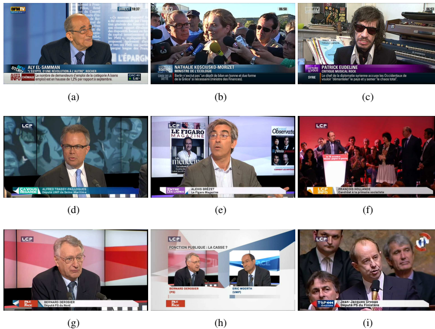
Figure 3. Exemples d'images du corpus REPERE

Sur le corpus phase 1, partie apprentissage, 724 personnes différentes ont été identifiées par leurs visages et 555 par leurs voix, pendant l'annotation manuelle. 1 907 des 11 703 occurrences de visages n'ont pas pu être identifiées ainsi que 255 locuteurs. Ces locuteurs correspondent à 25 minutes de temps de parole sur les 1 440 minutes annotées (466 tours de parole sur les 14 782). Pour la suite de l'article, nous ne nous intéressons qu'aux personnes qui ont pu être nommées pendant l'annotation.