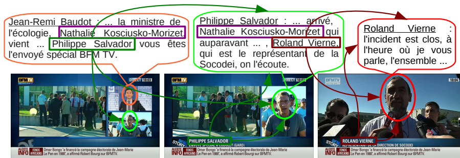
Figure 2. Noms prononcés et noms écrits pour le nommage des personnes

Plusieurs sources de noms sont issues d'annotations manuelles coûteuses, comme les sous-titres. Elles sont à écarter parce que c'est justement le coût d'annotation que nous voulons éviter. Par contre, deux autres sources intrinsèques aux flux télévisés sont disponibles : les noms prononcés dans la piste audio et les noms écrits en surimpression dans la piste image, en général dans un cartouche 3 . La figure 2 montre un extrait de journal télévisé avec le présentateur, un journaliste et une personne interviewée. Une corrélation est visible entre la prononciation ou l'écriture d'un nom et la présence auditive ou visuelle de cette personne.