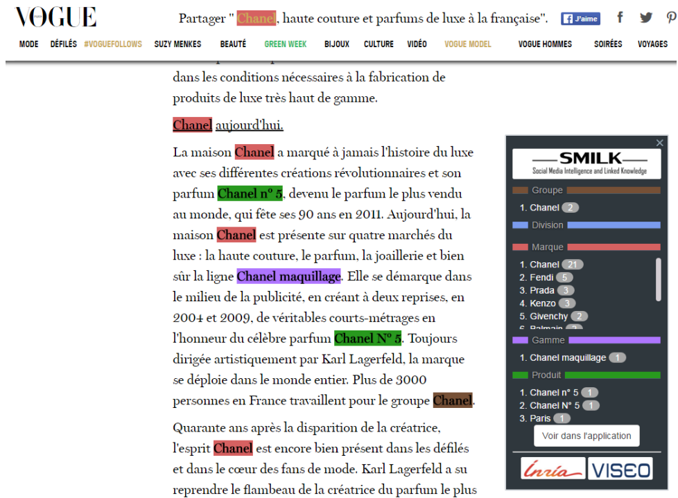
FIGURE 1 – Un résultat de l'extraction des entités d'intérêts sur une page Web de Vogue.fr.