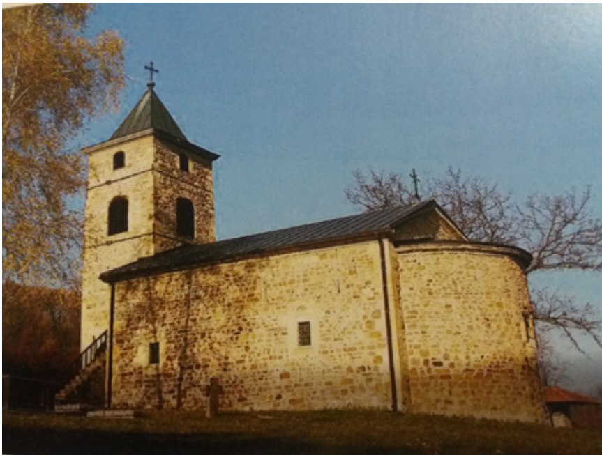
Сл. 6. Црква Светог Николе у Брусници, Настас Стефановић, 1836.