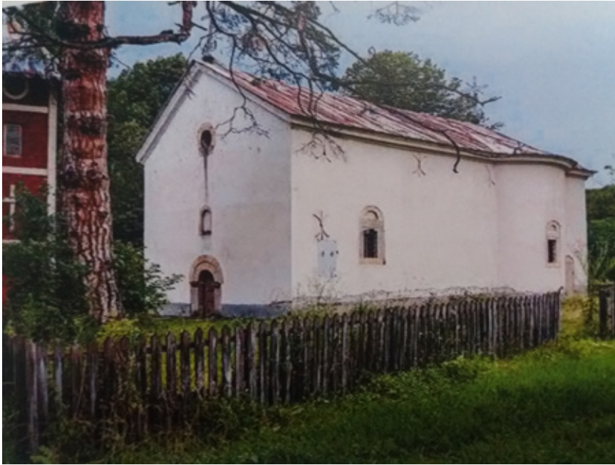
Сл. 5. Црква Светог Димитрија у Брезни, Настас Стефановић, 1837.