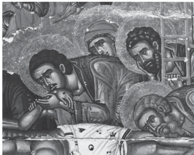
Сл. 9. Ојлакивање Христово, деиљ Великог крста, вероватно рад зографа Андреје, 1593/1594 Fig. 9. Lamentation, from the cross at the top of the iconostasis, probably by painter Andreja, 1593/1594

Наша претпоставка добија на тежини кад се зна да је у српској уметности друге половине XVI века заиста постојао сликар Андреја, који се знатно раније (1565) потписао на фресци светог Димитрија у припрати Пећке патријаршије: rlka mnogogy(Сna)go andree izografa . 67 Пошто се од чланова веће групе живописца која је осликала