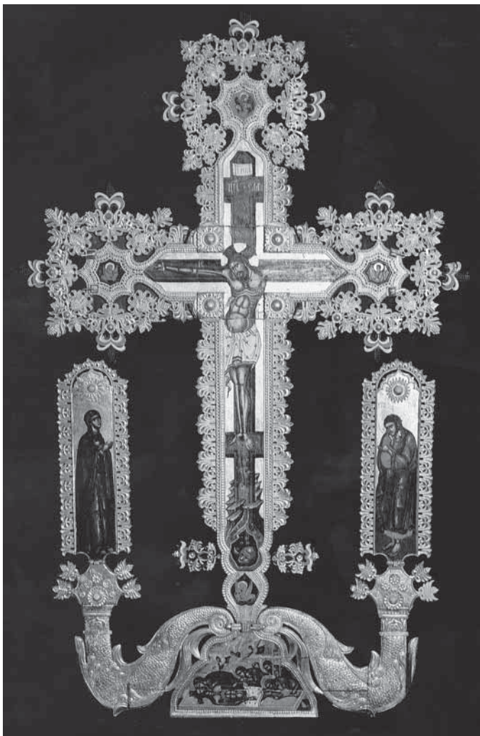
Сл. 8. Велики крст на иконостасу, 1593/1594 Fig. 8. The large cross at the top of the iconostasis, 1593/1594