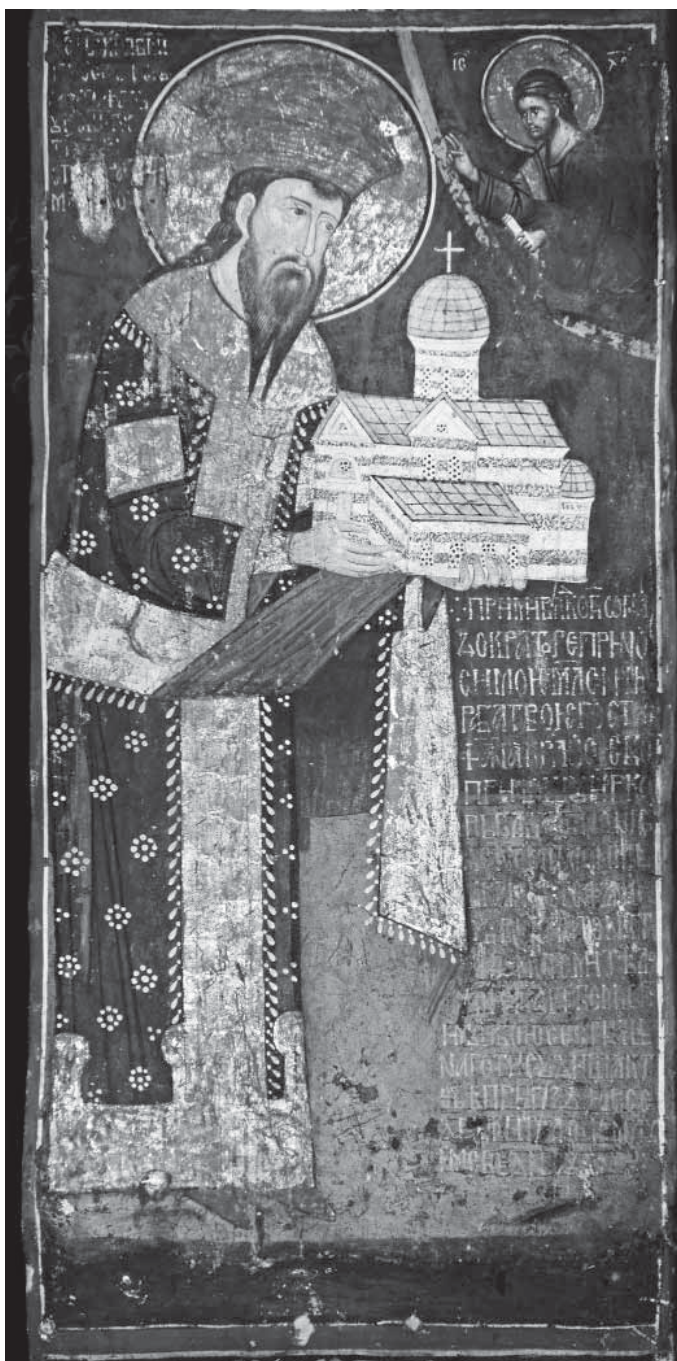
Сл. 3. Портрет светог Стефана Дечанског над кивотом испред иконостаса, 1343 Fig. 3. Portrait of St. Stefan Dečanski above the coffin, next to the iconostasis, 1343

верног дела иконостаса, између североисточног ступца и пролаза на олтарској прегради, због чега су његова лева и задња страна остале без дуборезног украса. 12 Смештање кивота на леву страну предолтарског простора било би веома необично — јер су ковчези с моштима светих, ако их није било више, испред олтарске преграде по правилу постављани здесна — кад не бисмо водили рачуна о тренутку у којем се то десило. Постављањем на леву страну намерно је избегнуто то да се тело Дечанског нађе непосредно пред Христовом иконом, која је редовно сликана на јужној страни иконостаса, јер су Стефану још били потребни свети молитвени заступници.