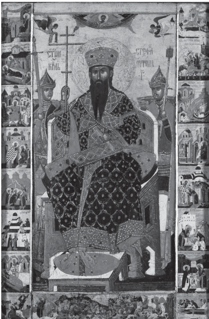
Сл. 4. Живијна икона светиог Сѣфана Дечанског, рад зографа Лонгина, 1577 Fig. 4. Painter Longin, Vita icon of St. Stefan Dečanski, 1577