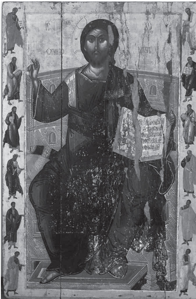
Сл. 6. Пресийона икона Христїа Панїокрайїора са айосїолима, рад зографа Лонгина, око 1590 Fig. 6. Painter Longin, Despotic icon of Christ Pantokrator with apostles, ca. 1590

делфини са чијих се репова издижу две издвојене иконе. Кракови крста завршавају се звездастим пољима, а окружују их раскошни и симетрично распоређени резбарени украси с мотивима крина и „дуплог крина“, палмете и шишарке. Стилизоване делфине прати издужено палимино лишће, а осликана поља, осим издвојених икона, опточена су низовима зрнаца. Сви ти резбарени украси позлаћени су и на пажљиво одабраним местима обојени у плаво и црвено. Четири цвета на укрсници одају домаћег дуборесца, а његово надахнуће Дечанима откривају орнаменти око крста и бочних икона, који понављају клесане мотиве са архитрава дечанске олтарске преграде из XIV века. 61 Разиграној, прозрачној и беспрекорно изведеној дуборезној структури крста савршено је прилагођен сликани украс.