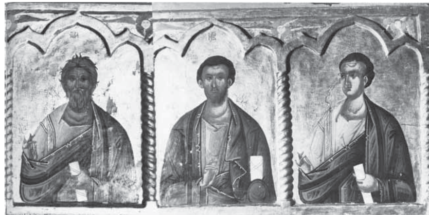
Сл. 7. Деузис с айосїолима, деїшаљ, крај XVI века Fig. 7. Deesis with apostles, a detail, end of sixteenth century

На крсту је насликан распети Христос, на завршцима кракова симболи јеванђелиста, на бочним издвојеним иконама фигуре Богородице и Јована Богослова (сл. 10), а на подножју крста Оплакивање Христово (сл. 9). Насликао их је неки добар и веома искусан сликар. Ликови и инкарнат изведени су густим, засићеним преливима зелене, маслинасте и плаве боје са црвеним и смеђим акцентима. Класично замишљено Оплакивање сложено је од савршено распоређених учесника драме, окупљених око мртвог Христа и покренутих према Богородици, која љуби сина. Слика је на крсту с највећом пажњом обрадио сваку појединост, од композиције и цртежа, преко верно приказаног обнаженог Христовог те-