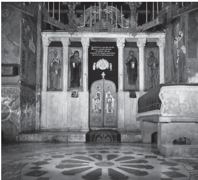
Сл. 1. Иконостаѕ и кивоћ свећног Стефана Дечанског Fig. 1. Dečani, iconostasis and coffin for the relics of St. Stefan Dečanski

стављањем бочних проскинитара, који су у ранијим храмовима обично грађени у камену или штуку.