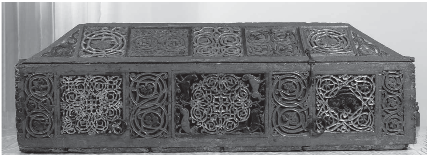
Сл. 2. Првобитни кивот за моштии светог Стефана Дечанског, 1343. Fig. 2. Original coffin for the relics of St. Stefan Dečanski, 1343