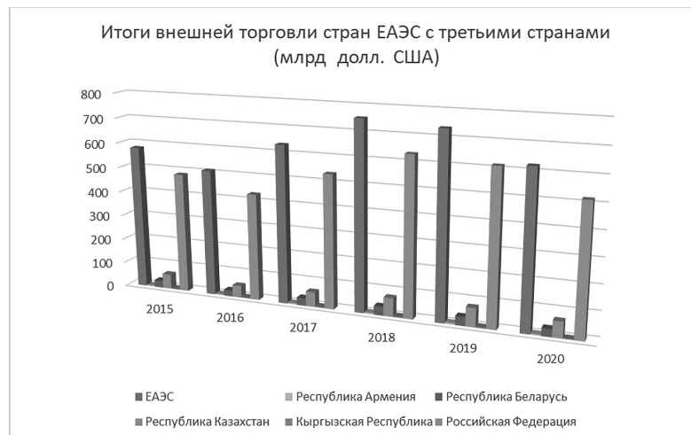
Рис. 2. Динамика внешней торговли стран — членов ЕАЭС с третьими странами

URL: http://eec.eaeunion.org/ (дата обращения: 13.07.2021).