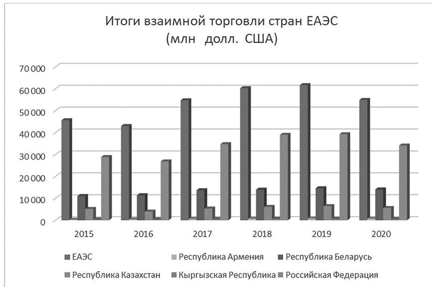
Рис. 1. Динамика взаимной торговли стран ЕАЭС