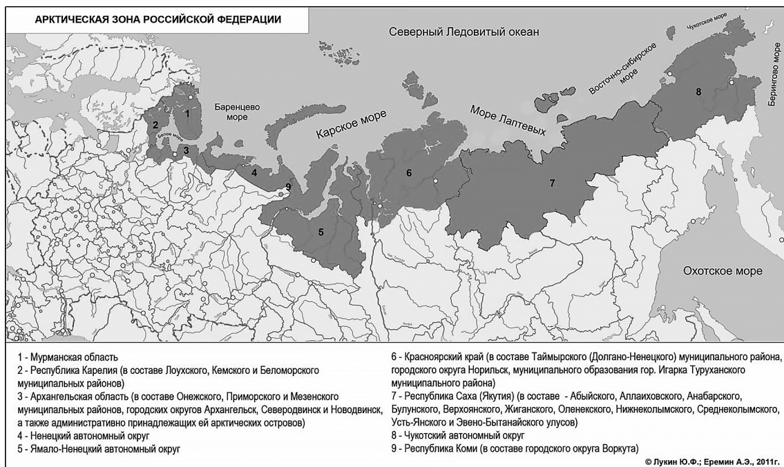
Рис. 1. Арктическая зона Российской Федерации

Fig. 1. Arctic zone of the Russian Federation