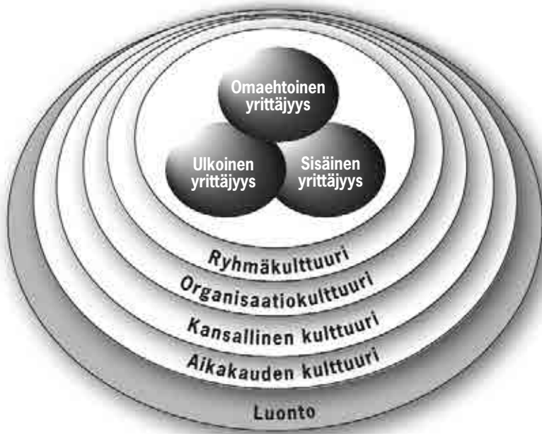
Kuvio 1. Yrittäjyiden muodot post-modernin murroksessa (Kyrö 1997).

liittyvät yksilölliset ja kollektiiviset, prosessit ja kompleksisen todellisuuden ja toiminnan jäsentäminen. Sille on myös leimaa-antavaa sellaisten metodologisten ratkaisujen etsiminen, jotka mahdollistavat pääsyn näiden prosessien tutkimiseen (Fayolle, Kyrö & Uljin (ed) 2004).