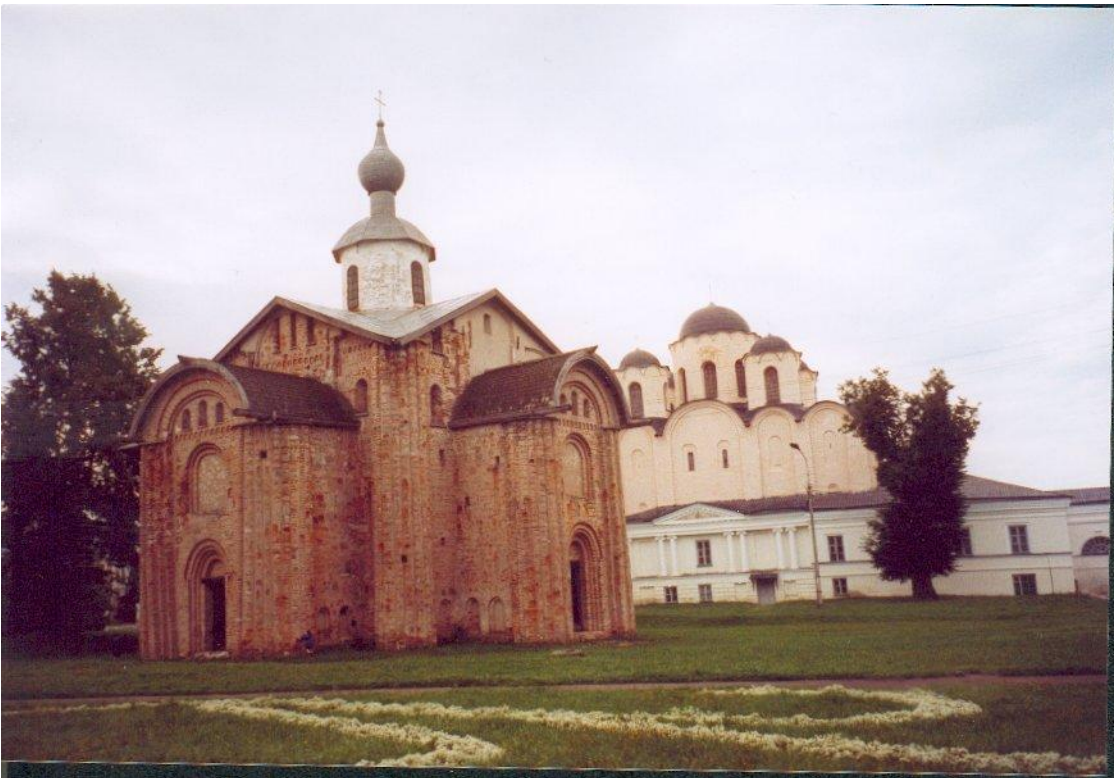
Paraskeva Pjatnitsan kirkko Novgorodissa. Juoksemalla kirkon ympäri kolme kertaa myötöpäivään pääsee naimisiin - ja vastapäivään kiertämällä saa avioeron?

Aineettomat taivaalliset jumaluudet tulivat aikaisempien maallisten, ihmismäisten jumalien tilalle. Elämän konkreettisten osa-alueiden personifikaatioiden sijaan astuivat abstraktit hyvyydet. Molemmissa uusissa yksijumalaisissa uskonnoissa tie pois ihmishahmoisista jumalista kävi kuvainraaston vaiheen kautta; kristinuskossa, varsinkin sen itäisessä muodossa, toki palattiin sittemmin kuvien, ikonien, pariin. Katolisella ajalla ihmishahmoiset, usein paikalliset jumaluudet syntyivät uudelleen pyhimyksinä; uskonpuhdistukseksi itsensä nimittänyt myöhempi kirkollinen kumousliike lakkautti ne sittemmin uudelleen. Voisiko olla, että uuspakanuus juuri sen takia nostaa päätään nimenomaan protestanttisella havumetsävyöhykkeellä?