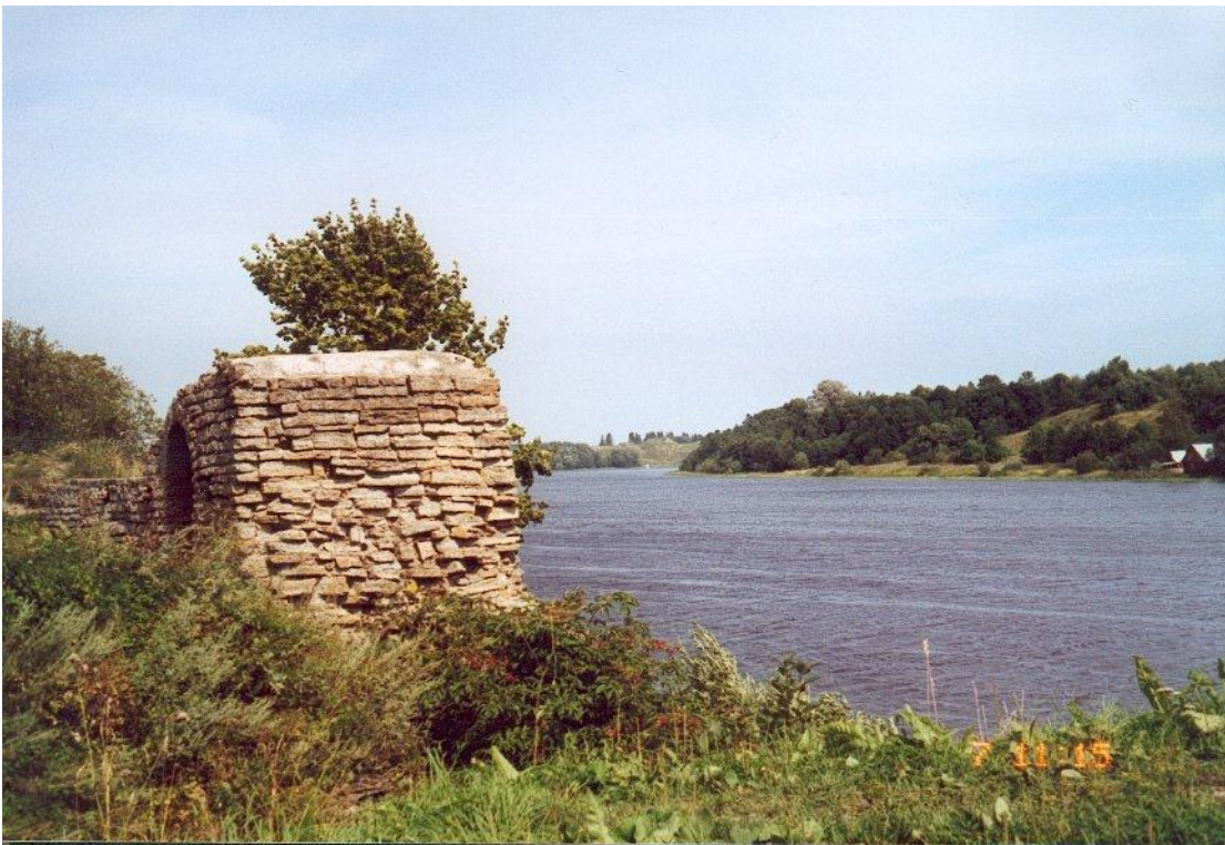
Keskellä kuvaa näkyy etäältä Oleg Viisaan hautakumpu joen varressa. Etualalla Staraja Ladogan muurien raunioita.

Oleg olisi hallitus kautensa päätteeksi halunnut palata omaa jokeaan alas Laatokalle ja edelleen kotiin Pohjolaan. Paikalliset tietäjät olivat kuitenkin ennustaneet, ettei hän pääse koskaan takaisin, ja kuinka kävi: mies kuoli käärmeen puremaan ja haudattiin suureen kumpuhautaan Olhavanjoen mutkaan, näköetäisyydelle Staraja Ladogan kaupungista. Myöhemmin hänen seuraansa liittyi muita ruhtinaita, joiden pienempiä kumpuja on molemmin puolin joen rannalla.