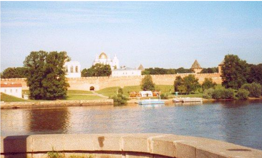
Novgorodin Kreml eli Detinets - ruhtinaan "lasten" eli sotilaitten majapaikka - joen vastarannalta nähtynä. Keskellä Pyhän Sofian katedraali.