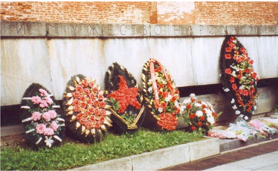
Kansakunnan miehuullisuutta ylistävä neuvostoaikainen Tuntemattoman Sotilaan hauta Novgorodin Kremlissä.

Jokea pitkin matkaavalle vaikutelma on samantapainen kuin Sormusten Herrassa: "Kauan olen halunnut nähdä esi-isieni hahmot." Aragornin esi-isät tosin olivat tavattavissa näköispatsaiden muodossa, mutta muuten matka Olhavanjokea pitkin on Rurikin ja Olegin heimolaisille voinut elämyksenä olla hyvinkin samanlainen kuin muinaisen Numenorin perilliselle. Suuren jokimatkan innoittajia on Tolkienilla epäilemättä ollut useita, mutta mallia on voinut antaa myös viikinkien idäntie. Suunta ainakin on sama, luoteesta kaakkoon, ja eteläpäässä on suuri kaupunki: Gondor, Bagdad tai Konstantinopoli. Tolkien tunnetusti osasi tšekäläisiä kieliä ja epäilemättä harrasti kotitarpeiksi myös tšekäläistä maantiedettä ja historiaa, ja on siis voinut käyttää Staraja Ladogan kumpuja omien kuningasmuistomerkkiensä esikuvana. Muutenhan Sormusten Herran hautakummut sijaitsevat - reaali maailman Upsalan tapaan - oikeaoppisesti taistelukenttien laidoilla.