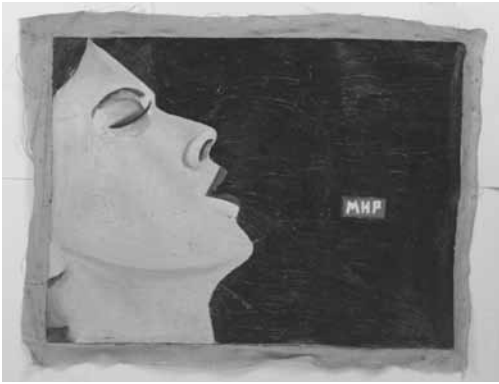
Vladimir Semjonov: Toukokuu – Työväki – Rauhaha, 1992.