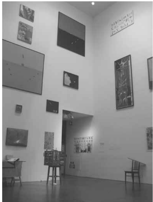
Näkymä Kiasman Studio K:sta.