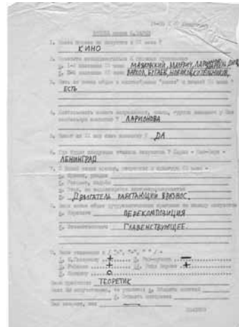
NTŠ/VTŠ: Kysely, 1980-luvun loppu.