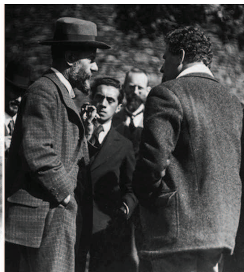
Max Weber vuonna 1878, 1894 ja 1917.