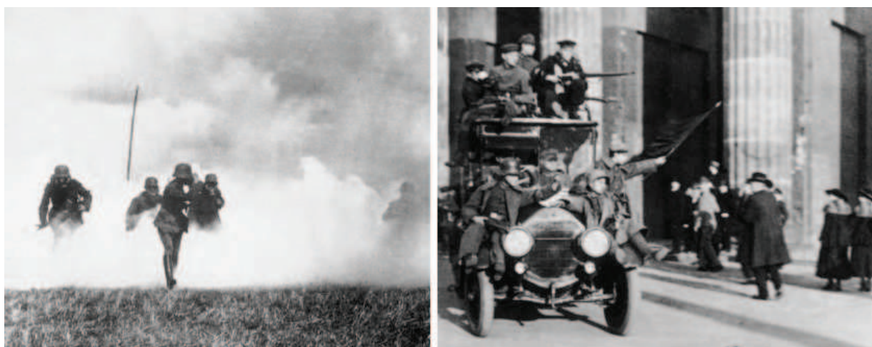
Puheiden taustaa. Vuosi 1917: Saksalaisten kaasuhyökkäys (vas.). Marraskuu 1918: Vallankumouksellisia Berliinissä.