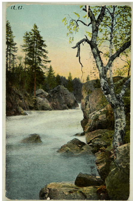
Kuva 5. Erämaan mystiikkaa. Koitajoen Pamilonkoski kuvattuna 1900-luvun alkuvuosien postikorttiin.

luonnon laajamittainen hyödyntäminen tukkilaistarinoineen oli peittämässä alleen kansallisromanttista erämaataulua.