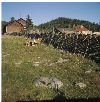
Kuva 4. Kaksi Kolia: kansallismaisema ja esi-isien elinympäristö.