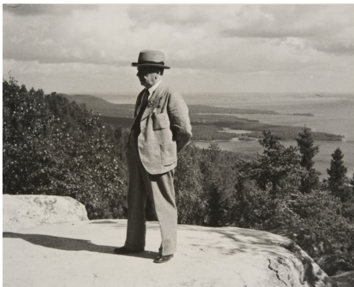
Kuva 6. Pohjoiskarjalaisen maiseman ikonisoitunut kuvataiteilija Eero Järnefelt Kolilla vuonna 1936.

Tämä luonnon rytmisissä elävien tarinankertojien paikallisuus ei juurikaan näy alueen markkinoinnissa, vaan matkailijoita varten konstruoidussa historiakulttuurissa Lieksa on useimmiten ulkopuolisen katseen kohde. Pohjois-Karjalan Matkailuyhdistyksen täytettyä 125 vuotta yhdistys valitsi juhluvuoden teemaksi karelianismin uuden tulemisen (Sulopuisto, 2018, s. 58). Alueella virinnyttä uskarelianismia edustaa vuonna 2015 perustettu Monola-seura, joka on keskittynyt ylläpitämään ”Sibeliuksen, Kalevalan ja karelianismin perintöä Pielisen-Karjalan alueella”. Sen ensimmäinen hanke on ollut Johan ja Aino Sibeliuksen häämatkakohteen, Monolan aitan, kunnostaminen ja hyödyntäminen alueen kulttuurimatkailussa. Elämyksellisyyttä on pyritty lisäämään kuljettamalla turistit Lieksan kirkolta koskiveneillä samaa reittiä kuin Sibeliuksen pariskunnan kerrotaan kulkeneen. (Monola-seura.) Karelianismin ja kansanuskon välistä suhdetta ilmentää Ukko-Kolin ystävät -niminen yhdistys, jonka ajattelussa aineettomaksi kulttuuriperinnöksi mielletty kalevalainen luontosuhde ja hengellinen luontokokemus kytkeään Kalevalaan ja kansallistaitelijoihin (Ukko-Kolin ystävät).