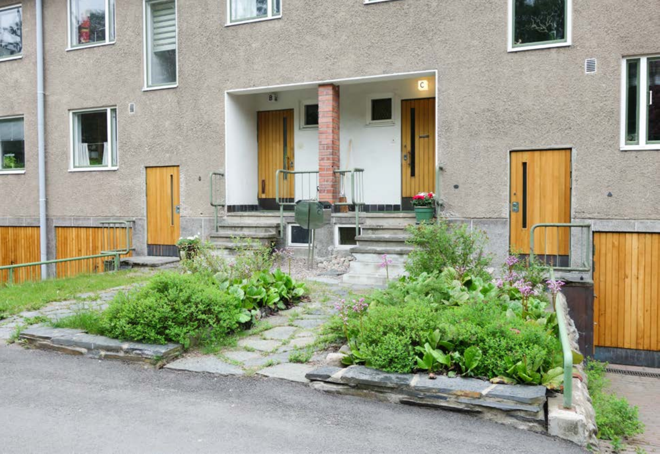
KUVA 3 Vanhoissa kerrostaloissa on usein esteettömyyteen liittyviä haasteita ja niistä puuttuvat hissit.

ikäisten kanssa, vaan toivoivat enemmän mahdollisuuksia ylisukupolviin kohtaamisiin. He totesivat kuitenkin eläkkeellä olevien ja työssäkäyvien asukkaiden erilaisen päivärytmin olevan osasyyn yhteisen tekemisen puutteeseen. Kaupunkiviljely, pihapelit kuten petankki ja viihtyisät oleskelupaikat pihalla voivat edesauttaa luonnollisia kohtaamisia asukkaiden kanssa. Hankkeen aikana Jakomäen Vuorensyrjän palvelutalossa tehdyssä vastaavassa asukastyöpajassa asukkaat kertoivat, että näkymät pihalle ja muiden asukkaiden toiminta pihalla houkuttelivat heidät ulos asunnoistaan. Toisaalta asukkaat, joilla ei ollut näköyhteyttä pihalle, kokivat jäävänsä paitsi näistä itsestään syntyvistä sosiaalisista tapahtumista.