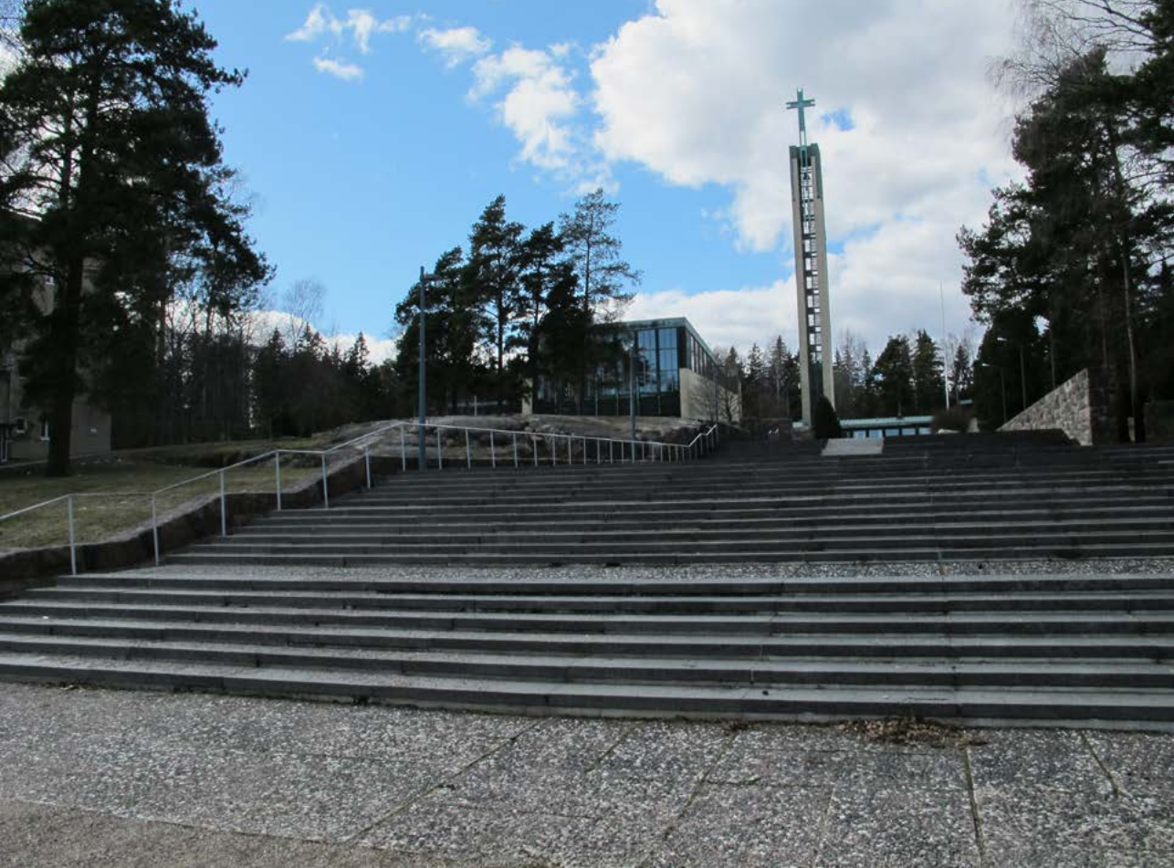
KUVA 5 Maamerkinä toimiva kirkko on fyysisesti ja kulttuurisesti huonosti saavutettava kohtaamispaikka.

voivat aiheuttaa tahattomia esteitä liikkumiselle. Haasteena on myös se, että rakentamisesta ja käytöstä aiheutuva kulut kuuluvat eri toimijalle.