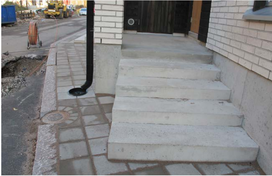
KUVA 2 Lapsiperheille suunnatun asuinalueen toteutus ei tue esim. lastenrattaiden kanssa kulkemista.

ja 16 vuotta nykyisessä asunnossaan. Yli 85-vuotiaiden vastauksissa (N=10) luvut olivat korkeammat: he olivat asuneet 36 vuotta alueella ja 33 vuotta nykyisessä asunnossa. Kyselyyn vastanneista yli 85-vuotiaista naisista (N=8) kaikki asuivat yksin.