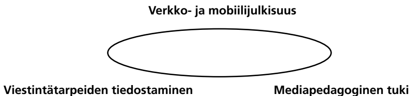
Kuvio 2. Kansalaisten verkkojulkaisemisen ehdot

Pedagogisen tuen merkitys on havaittu myös aikuisten kansalaisverkkokokeiluissa. Esimerkiksi tamperelaisen Mansetorin ja oululaisen Naapurit.net-sivuston kehittämisessä asukkaiden ja yhteisöjen vahvistumiseen ja verkkojulkisuudessa osallistumisen edistämiseen tarvittiin seuraavia elementtejä, joista Vaikuttamossa toteutuvat ainakin verkkojulkisuus ja mediapedagoginen tuki (Kotilainen 2004, 296):