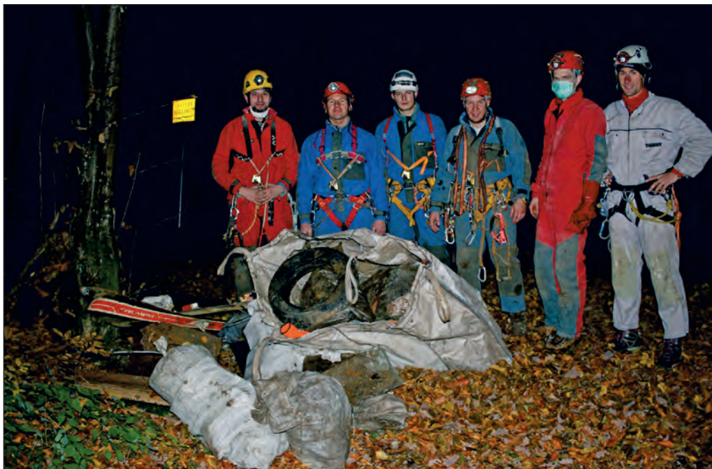
Otpad izvađen iz samoborskih Medjama u studenom 2015. Osim komunalnog otpada i životinjske strvine, MUP je iz jame uklonio i dvije ručne granate

Čisto podzemlje je ažuran registar podzemnih divljih deponija. Danas se u KOSO bazi nalaze zapisi o 591 onečišćenom speleološkom objektu. U izradi baze sudjelovalo je 12 speleoloških udruga i Javna ustanova Park prirode Učka. Uz postojeće arhivske podatke, više puta smo objavili i svježe terenske nalaze. Speleolozi su na istraživanjima pronašli nova onečišćenja, kojima smo upotpunili bazu, a obradovala nas je i prva prijava građana o bacanju otpada u podzemlje. To su dokazi da je „Čisto podzemlje“ prihvaćeno i živo, a u takvim trenucima osjećamo da se sav uloženi trud isplatio. Iako je okolica jama ponekad čista, podzemlje često skriva ekološku katastrofu kakvu su dosad vidjeli isključivo speleolozi. Pobrinuli smo se da „prljavo rublje“ izađe na površinu jer smo na stranici prikazali 146 galerija fotografija koje zorno pokazuju podzemne deponije. To je ključan alat kojim senzibiliziramo javnost, ali i odgovorne institucije da ne ignoriraju ovaj problem. Treba napomenuti da država prepoznaje važnost evidencije i sanacije ilegalnih (podzemnih) deponija, kao