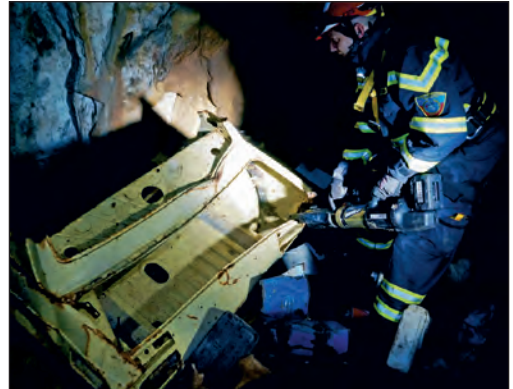
Rezanje auto olupine u jami Pavlovići