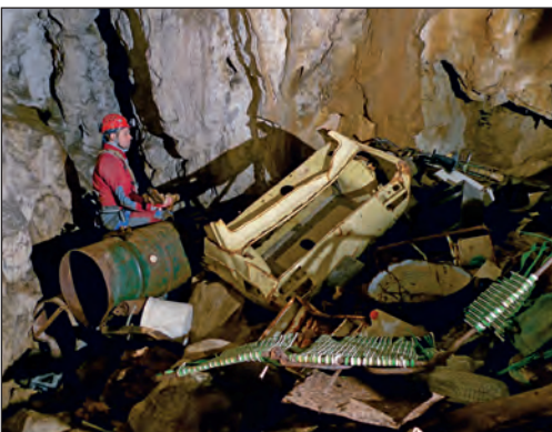
Krupan otpad u žumberačkoj jami Pavlovići

Osim granata, prilikom čišćenja jame Pavlovice suočili smo se s krupnim otpadom koji bismo teško izvukli samo speleološkim tehnikama. Radilo se o automobilskoj karoseriji,