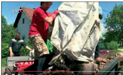
Prilog HRT-a o čišćenju jame Korčinke od komunalnog otpada i minsko-eksplozivnih sredstava

u edukaciji širokih masa mediji. Godišnje organiziramo nekoliko volonterskih akcija čišćenja otpada iz podzemlja, a svaka od njih je dobra prilika za promociju Inicijative. Dugoročni su ciljevi edukacije potpuno iskorjenjivanje prakse bacanja otpada u podzemlje i sanacija svih speleoloških objekata. To se može ostvariti trajnim angažmanom i stalnim medijskim praćenjem naših aktivnosti. Znanje se množi dijeljenjem!