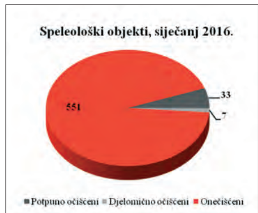
Dostupni podaci o dosad organiziranim akcijama čišćenja špilja i jama u Hrvatskoj