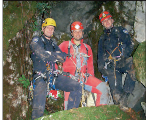
U uklanjanju minsko-eksplozivnih sredstava ključna je suradnja s MUP-ovom Protueksplozijskom službom

komad eksplozivnih sredstava, ukupne mase preko 100 kg. Zastrašujući je podatak da smo u svakom vertikalnom objektu koji smo čistili pronašli zaostala minsko-eksplozivna sredstva. Radi se o jamama u blizini Crikvenice, Kastva i Samobora, a ne samo u područjima koje povezujemo s Domovinskim ratom. Ova velika opasnost ukazuje na obavezu uključivanja nadležnih službi u akcije čišćenja jama. Posebno su opasne granate iz razdoblja Prvog i Drugog svjetskog rata, jer je malo speleologa koji bi u njima prepoznali smrtnu opasnost. Te naprave ponekad izgledaju atipično i lako ih je zamijeniti s uporabnim predmetima, pogotovo ako su djelomično zatrpane zemljom ili otpadom. Treba znati da u trajnim meteorološkim uvjetima, kakvi vladaju