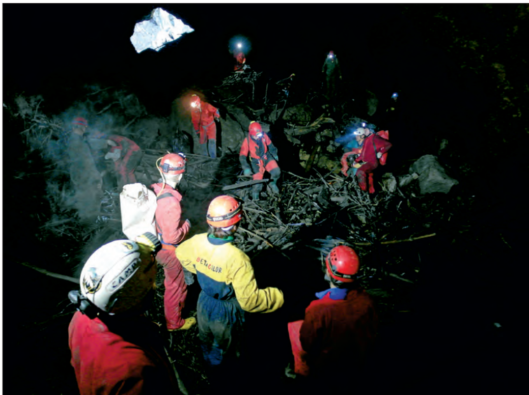
Krajem 2015. sudjelovalo je dvadesetak speleologa u čišćenju otpada iz Đulinog ponora kod Ogulina

Tijekom 2015. uspostavili smo odličnu suradnju s MUP-ovom protueksplozijskom postrojbom na uklanjanju ove velike opasnosti za speleologe. Dosad je u okviru Inicijative uklonjeno 40 komada eksplozivnih sredstava. Primjerice, iz kršljive i vrlo uske jame Babe uklonjen je s dubine od 30 metara je 31