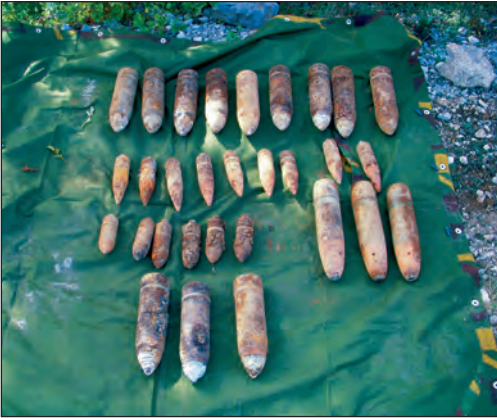
Preko sto kilograma eksploziva, 30 topničkih granata iz Drugog svjetskog rata uklonjeno je iz jame Babe kod Crikvenice