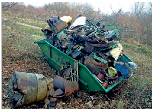
Kontejner uz jamu Pavlovicu pun krupnog otpada – završeno uspješno čišćenje jame u suradnji sa zagrebačkim vatrogascima

i da su speleološki objekti proglašeni posebnim državnim interesom, no jasno je da je to mrtvo slovo na papiru. Speleolozi su u ovoj priči jedini koji žele i mogu ostaviti traga.