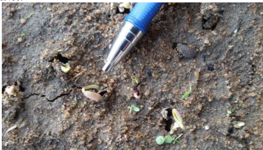
Figure 2: Graines de Acacia auriculaeformis germées

Les semences ont été introduites à une profondeur comprise entre 0,60 cm et 1 cm dans le sachet de pépinière. Deux arrosages par jour (le matin et le soir), ont été effectués afin de maintenir constamment l'humidité dans le milieu. L'opération a duré 20 jours. Une graine est considérée germée lorsque la plantule émerge du sol (Figure 2). Le nombre de graines germées par jour a été compté pendant deux semaines. Les observations des semences ont pris fin lorsqu'après deux comptages successifs aucune germination n'est observée.