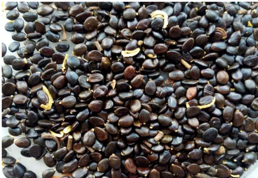
Figure 1 : Graines de Acacia auriculaeformis

Les semences ont été introduites à une profondeur comprise entre 0,60 cm et 1 cm dans le sachet de pépinière. Deux arrosages par jour (le matin et le soir), ont été effectués afin de maintenir constamment l'humidité dans le milieu. L'opération a duré 20 jours. Une graine est considérée germée lorsque la plantule émerge du sol (Figure 2). Le nombre de graines germées par jour a été compté pendant deux semaines. Les observations des semences ont pris fin lorsqu'après deux comptages successifs aucune germination n'est observée.