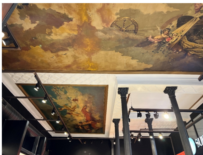
Fig. 3: calle Granada 7. Techo del negocio actual en el que se conservan las pinturas originales, datadas entre finales del siglo XIX y principios del XX.

Igualmente, trata los aspectos internos del patrimonio inmueble en un artículo sobre portales y escaleras (2009) y de manera más exhaustiva, junto con otros, en el libro resultado de su tesis doctoral: La Vivienda Malagueña del Siglo XIX (2000), que dos décadas después, se ha convertido en un enriquecedor patrimonio documental ya que gran parte de los ejemplos que recoge, desafortunadamente, han desaparecido. Un tercer texto que se puede vincular a los perjuicios que produce el fachadismo trata sobre las decoraciones de los comercios, «práctica muy extendida en la segunda mitad del siglo XIX y comienzos del XX», y de la que quedan poquísimos ejemplos. Uno de ellos, en calle Granada [Fig. 3], analizado en él (2003, p. 549 y ss.); y, otro en Especerías , en un edificio que está actualmente siendo intervenido.