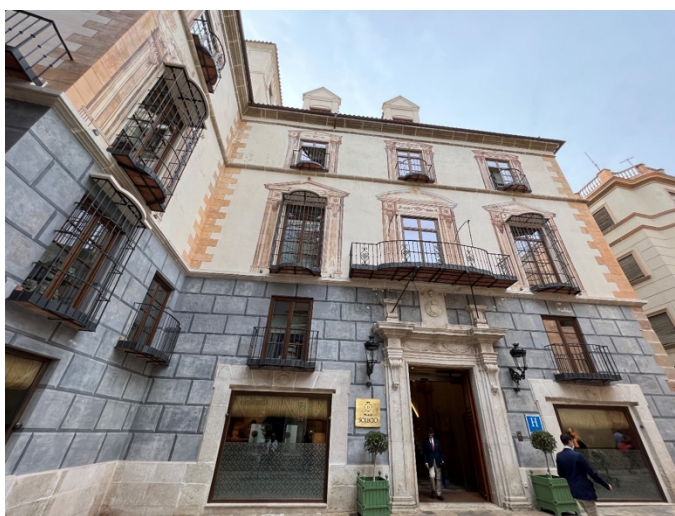
Fig. 4: Palacio del marqués de la Sonora , en calle Granada. La fachada es el único resto que se mantuvo, junto al zaguán, datados a finales del siglo XVIII.

Las obras incluidas en esta definición no podrán ser otras que las que aclaren la lógica del proceso acumulativo de arquitecturas en el tiempo. La eliminación de elementos estructurales de cualquier tipo sólo podrá realizarse con dicho fin y siempre en el caso de suponer añadidos que contribuyan a la degradación del edificio (Gerencia Municipal de Urbanismo, 2016, p. 35).