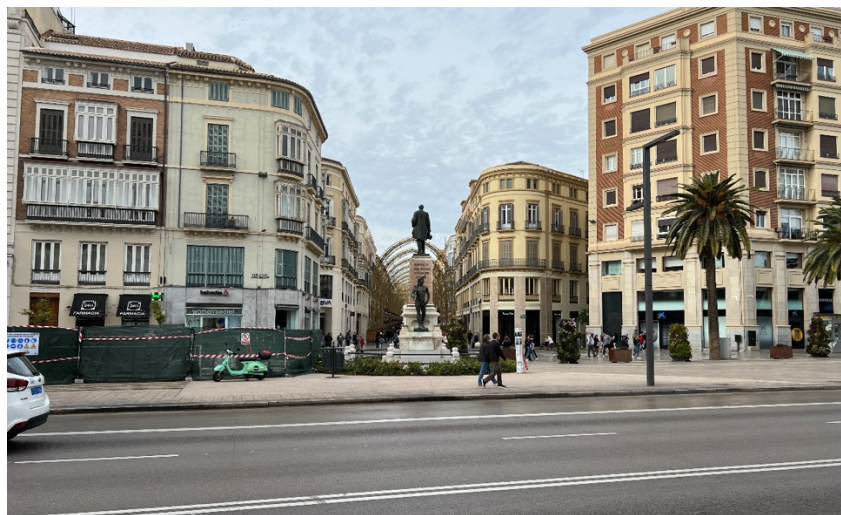
Fig. 6: Monumento al marqués de Larios. Emplazamiento actual