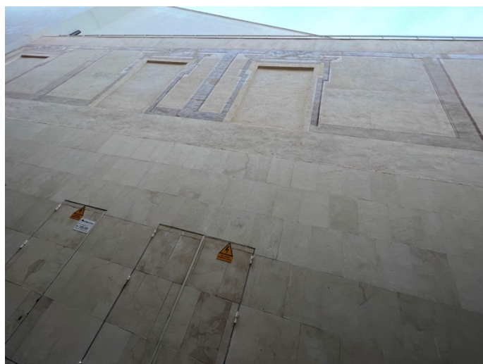
Fig. 2: Museo Carmen Thyssen. Fachada lateral con pinturas murales datadas en la década de 1780.

Asimismo, se recogen como efectivas las revalorizaciones de diversos entornos urbanos mediante la recuperación de edificios históricos o la inserción de nuevas dotaciones. Cabe puntualizar que, mayoritariamente en estos casos, se da prioridad a las necesidades que presentan los nuevos usos, lo que conlleva demoliciones completas o parciales. Paradójicamente esto también suele ocurrir en edificios destinados a futuros contenedores de una colección mediante la cual se pretende poner en valor el patrimonio cultural. Uno de los ejemplos citados es el museo Carmen Thyssen Málaga , cuyo conjunto ha recuperado la parte más noble del mismo, el palacio de Villalón , con origen en el siglo XVI y una modificación y ampliación en el XVIII. Estos periodos son perfectamente legibles en la zona del patio, dejando así atrás las desafortunadas modificaciones que sufrieron sus elementos a mediados de la centuria del XX. Pero, por otro lado, el resto de volúmenes que lo componen se han levantado de nueva planta 3 , sustituyendo un patrimonio arquitectónico precedente, entre el que se encontraba la institución de Estudios Reales de Gramática, Retórica y Pintura, de la cual tan sólo se han conservado algunas pinturas murales [Fig. 2] (Guillén, 23 de febrero de 2009).