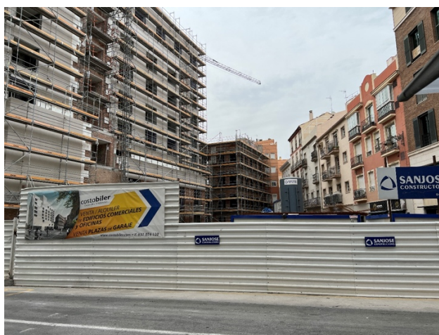
Fig. 5: Hoyo de Esparteros. Construcción de nuevos edificios en marzo de 2022.

Otra tipología que preocupó a García Gómez fue la de los 'corralones', elementos más humildes que los ya citados, pero destacados «tanto por su interés arquitectónico como por su papel de testimonios de los modos de vida de las clases trabajadoras» (2013, p. 302), sobre