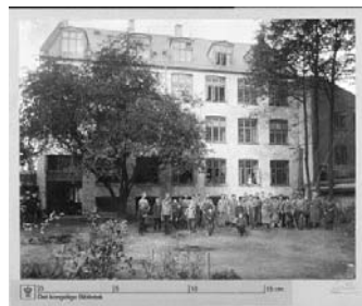
写真2 「障害者のための社会と家」の男子寮 (1898年)