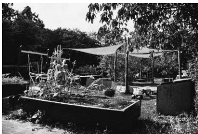
写真4 活動の場の様子

特別保育施設(Specialinstitutionen Centerbørnehaven)は「子どもにとって安全で良い子ども時代を送ること、子どもの一般的な幸福を確保し、子どもがもつ潜在能力を最大限発揮できるように支援すること」を目的としている。活動内容は遊び・外出・共同活動など、通常の保育施設での日常生活と可能な限り近い活動が行われている。その中で子どもの運動と認知を発達させ、可能な限り自立できるようになることがめざされ、理学療法と作業療法を通じて個別のトレーニング活動が組織されている。1日の活動は遊びに重点を置き、誕生日・お茶会など構造化されたロールプレイングゲーム、認知を強化するゲームやタスク、グループ活動では対話型読書、クライミング、アウトドアや焚き火を行っている(写真4)。