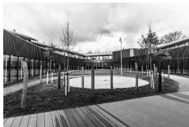
写真6 Heerup Skole

「Heerup Skole」は肢体不自由（運動障害）児童生徒を対象とした特別学校であり、定員90人、1～10年生を受け入れている（写真6・7）。コペンハーゲン市のハビリテーションセンター「コペンハーゲン子どもセンター（Børnecenter København）」のスタッ