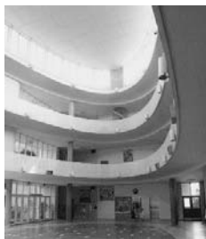
写真5 Skolen ved Sundet の内観

コペンハーゲン市の国民学校「Skolen ved Sundet」には肢体不自由(運動障害)やそ