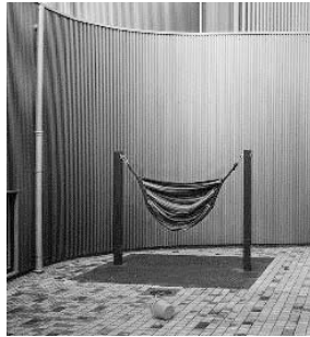
写真7 各クラスの屋外スペースにあるアクティビティ ( https://www.rumsans.dk/artikler/heerup-skole )

フが定期的に学校を訪問支援している。入学するためにはコペンハーゲン市による教育心理学的評価（PPR）を受ける必要があるが、子どもセンター所属の心理士・言語聴覚士・理学療法士・作業療法士等がその実務も担当している。