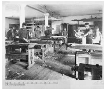
写真3 「障害者のための社会と家」の建具工房（1898年）

( http://www5.kb.dk/images/billed/2010/okt/billeder/object284646/en/ )