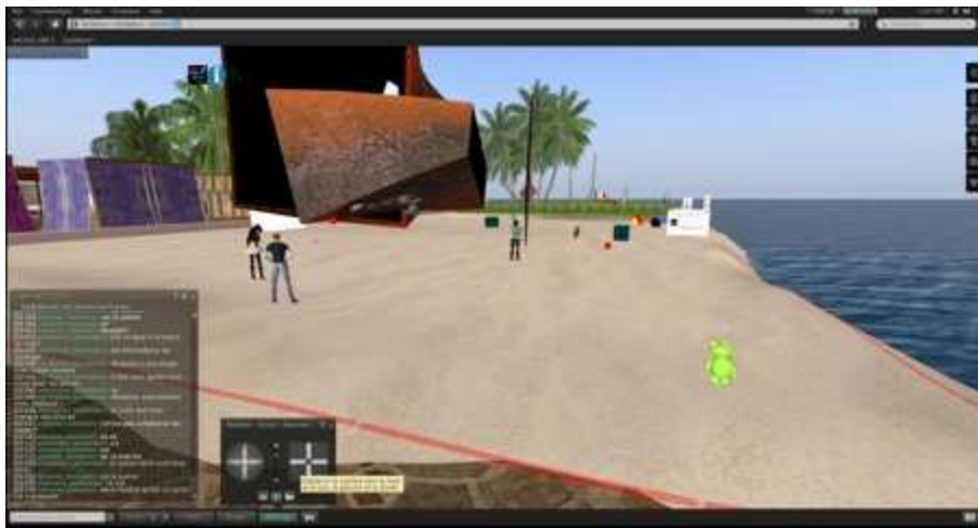
Figure 6 : écran de l'avatar-chercheur. Participants en mouvement

Une difficulté s'est présentée dans l'activité de construction. Comme on le voit dans la figure suivante, les apprenants construisaient un objet en collaboration. Ils étaient donc sans cesse en mouvement et le chercheur devait forcément se déplacer pour pouvoir capter les actions des apprenants.