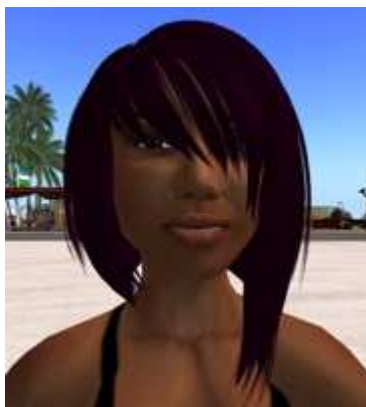
Figure 1 : avatar dans Second Life