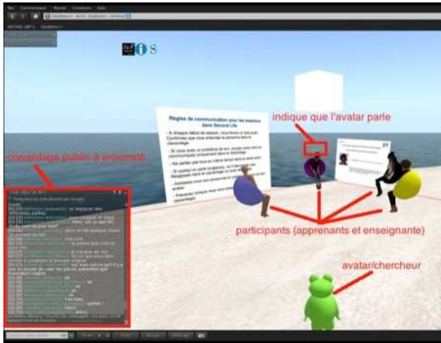
Figure 5: écran de l'avatar-chercheur. Participants immobiles

Une difficulté s'est présentée dans l'activité de construction. Comme on le voit dans la figure suivante, les apprenants construisaient un objet en collaboration. Ils étaient donc sans cesse en mouvement et le chercheur devait forcément se déplacer pour pouvoir capter les actions des apprenants.