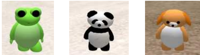
Figure 4 : Avatars-chercheurs pour le projet Archi21

Pour le projet ARCHI21, nous avons demandé aux apprenants de créer un avatar spécialement pour le projet même si certains en avaient déjà un. Nous leur avons demandé de donner un nom spécifique à leur avatar (leur prénom suivi d'une particule) afin de pouvoir les identifier facilement comme faisant partie de la formation. En ce qui concerne l'aspect recherche, nous avons décidé de créer des avatars seulement à des fins d'enregistrement. Pour éviter que les apprenants ne les confondent avec d'autres participants et pour éviter qu'ils n'interagissent avec le chercheur (notre observation est donc extérieure et non participante dans ce cas), nous avons choisi de leur donner la forme d'animaux.