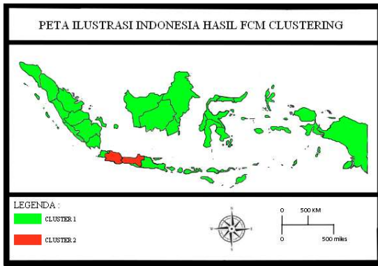
Gambar 3 Peta Ilustrasi Indonesia Hasil FCM Clustering

Dari Gambar 3 dapat diketahui bahwa pengelompokan menggunakan metode FCM clustering membagi provinsi di Indonesia menjadi 2 cluster. Dengan cluster 1 yang dilambangkan dengan warna hijau, yang beranggotakan 32 provinsi di Indonesia yaitu Aceh, Sumatra Utara, Sumatra Barat, Riau, Jambi, Sumatra Selatan, Bengkulu, Lampung, Kep Bangka Belitung, Kepulauan Riau, DKI Jakarta, Di Yogyakarta, Banten, Jawa Timur, Bali, Nusa Tenggara Barat, Nusa Tenggara Timur, Kalimantan Barat, Kalimantan Tengah, Kalimantan Selatan, Kalimantan Timur, Kalimantan Utara, Sulawesi Utara, Sulawesi Tengah, Sulawesi Selatan, Sulawesi Tenggara, Gorontalo, Sulawesi Barat, Maluku, Maluku Utara, Papua Barat, dan Papua. Sedangkan, untuk cluster 2 dilambangkan dengan warna merah, yang beranggotakan 2 provinsi yaitu Jawa Barat dan Jawa Tengah.