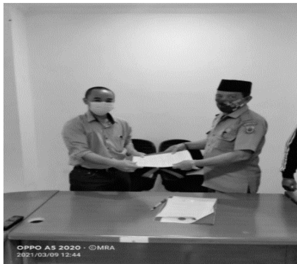
Gambar 3. Penyerahan MoU

Pada tahapan pelaksanaan Pengabdian kepada masyarakat berupa kegiatan pengujian terhadap kemampuan kompetensi calon aparat desa terhadap pengetahuan umum dan cara penggunaan computer yang dilaksanakan selama dua hari yaitu bertempat di laboratorium dasar Program Studi Teknik Informatika dengan mempraktekan langsung bagaimana membuat dokumen dengan menggunakan aplikasi Microsoft Office, di antaranya yang digunakan adalah Microsoft Word dan Microsoft Excel. Di bawah ini gambar kegiatan pelaksanaan yang dilakukan.