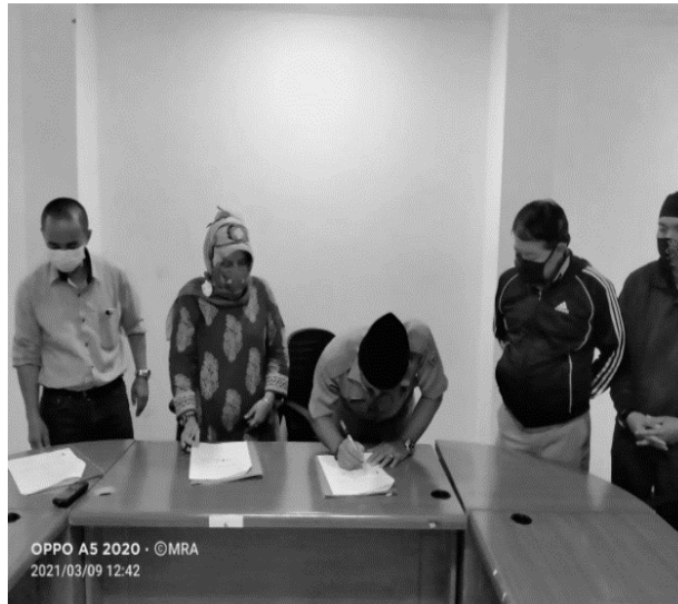
Gambar 2. Penandatanganan MoU