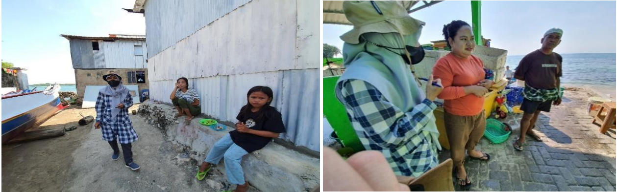
Gambar 1. Pelaksanaan Survei Sosial, Lingkungan, Kesehatan Masyarakat

tahun, dengan profesi sebagai nelayan (20%), pedagang (24%), dan pegawai swasta (20%), selebihnya adalah aparatur sipil pemerintah. Mereka umumnya berpendapatan dibawah dua juta lima ratus ribu rupiah.