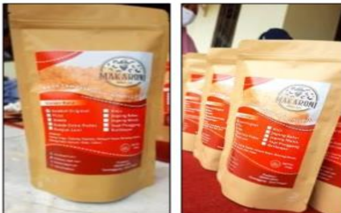
Gambar 4. Kemasan Baru Makaroni