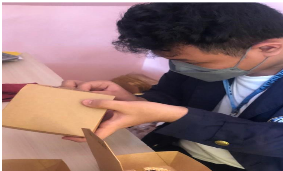
Gambar 5. Tim Pengabdian Memberi Pelatihan Inovasi Packing