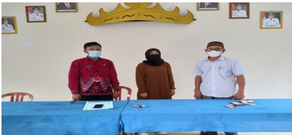
Gambar 6. Tim Pengabdian Bersama Pemilik UMKM Makaroni

Adapun beberapa hasil yang didapatkan dari kegiatan pengabdian kepada masyarakat di antaranya adalah :