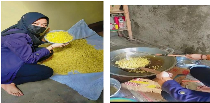
Gambar 1. Proses Pembuatan Makaroni

Tanjung senang adalah kelurahan yang terdapat di kecamatan tanjung senang, Bandar Lampung yang beralamat di Jl.Damai, Tanjung Senang yang berjumlah penduduk 39.032. Di Tanjung Senang terdapat beberapa UMKM salah satunya UMKM Makaroni yang merupakan salah satu makanan yang sering dikonsumsi oleh masyarakat. Pak Supono pemilik UMKM Makaroni yang beralamat di Jl.Cendana Tanjung Senang. Sudah hampir tiga tahun bapak supono menjalankan usaha makroni ini. Makaroni yang dibuat ada beberapa varian rasa yaitu rasa original, pedas dan jagung manis yang di jual dalam kemasan bal, harga 1 balnya Rp.35000. Beliau memasarkan makaroni dititipkan di warung-warung, harga satuan di jual di warungnya Rp 500 rupiah. Dalam produksi makaroni setiap bulan menghabiskan sekitar 2 Ton makaroni mentah. Semenjak pandemi beberapa tahun ini omset nya pun menurun. Penjualan selama ini mengharuskan konsumen yang ingin memesan atau membeli produk untuk datang langsung ke lokasi atau memesan lewat WhatsApp untuk melihat produk yang akan dibeli. Solusi dari masalah yang dihadapi adalah membuat akun sosial media atau marketplace untuk memudahkan dalam memesan dan melihat detail produk serta harga produk yang akan dipesan atau dibeli. Akun sosial media dan marketplace ini juga mempermudah konsumen yang berada di luar daerah, agar konsumen tidak perlu repot untuk datang ke lokasi untuk membeli atau memesan produk yang ada.