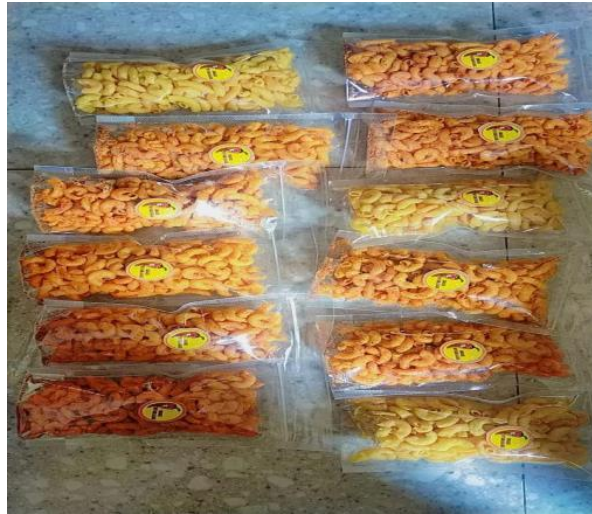
Gambar 2. Kemasan Lama Makarani

Dengan adanya pelatihan tentang bagaimana memasarkan suatu produk lewat media sosial dan marketplace didapatkan juga ilmu tentang bagaimana kemasan dan ajakan yang menarik minat konsumen. Dengan adanya pelatihan ini pula, masyarakat dapat lebih mengenal kemajuan teknologi dan dapat menggunakannya dengan sebaik mungkin dalam kehidupan sehari-hari. Selain itu, dengan adanya akun sosial media atau marketplace dapat mendukung masyarakat untuk lebih mengenal teknologi dalam dunia pemasaran, dan adanya kemasan yang menarik dapat meningkatkan minat konsumen.