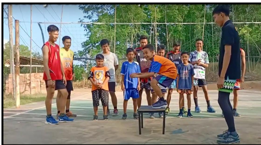
Gambar 3. Pelaksanaan Pengabdian Masyarakat pada Materi Aktivitas Multilateral Gerak pada Cabang Olahraga Bola Voli menggunakan Box Jump Portable

Pelaksanaan kegiatan pengabdian masyarakat melalui sosialisasi secara detail terangkum dalam tabel 1. Sosialisasi dilaksanakan selama 2 hari adapun dampak dari kegiatan pengabdian masyarakat ini yaitu anggota Karang Taruna Desa Sialang Agung, Plakat Tinggi, Musi Banyuasin memiliki peningkatan pengetahuan tentang program pembinaan kehidupan sosial yang terdiri dari: 1) Aktivitas Multilateral Gerak pada Cabang Olahraga Bola Voli menggunakan Box Jump Portable , 2) Model Latihan Box Jump Portable untuk meningkatkan vertical jump 3) Bisnis Model Canvas pada Produk Box Jump Portable , 4) Komunikasi Pemasaran Alat Olahraga.