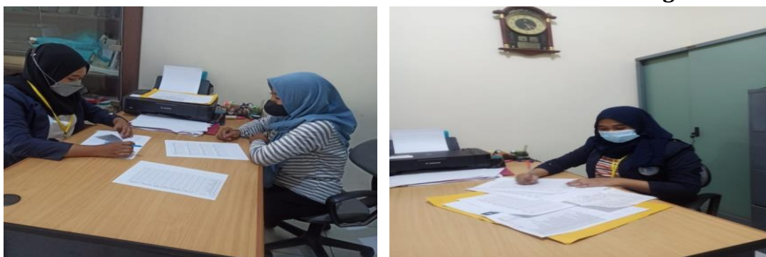
Gambar 3. Edukasi Pelaporan keuangan kepada Pemilik UMKM