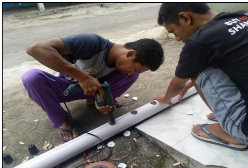
Gambar 1. Proses Pelubangan Pipa