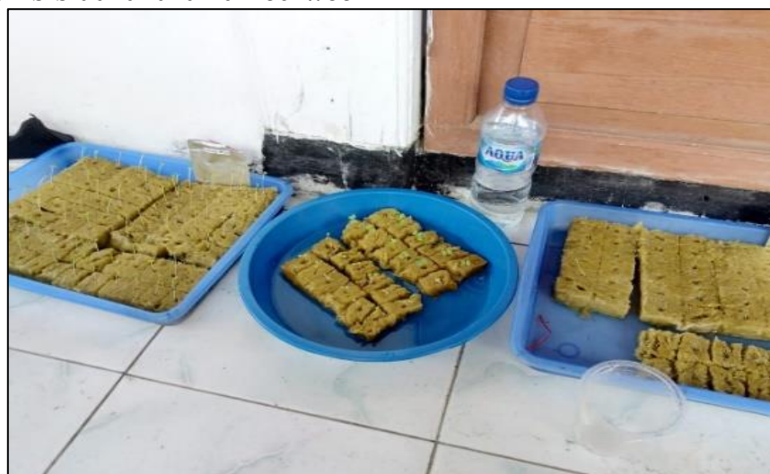
Gambar 2. Penyemaian Bibit