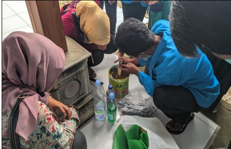
Gambar 4. Pencampuran Nutrisi