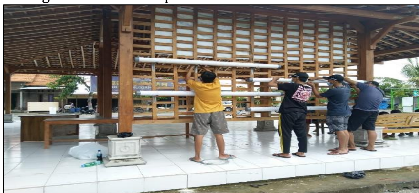
Gambar 3. Proses Pemasangan Instalasi Rangka Hidroponik