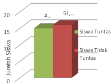
Gambar 3. Diagram Presentase Ketuntasan Hasil Belajar Siswa Kelas Kontrol

Dari keseluruhan skor hasil belajar siswa kelas X MIPA 1 yaitu kelas yang pada proses pembelajaran tidak diterapkan metode enrichment diperoleh sebanyak 15 siswa yang mencapai KKM yaitu dengan presentase ketuntasan 48,38% dengan kriteria ketuntasan minimal (KKM) yang telah ditetapkan disekolah untuk mata pelajaran fisika adalah 75. Sedangkan siswa yang memperoleh skor dibawah KKM sebanyak 16 siswa dengan presentase ketuntasan sebesar 51,61%. Hal tersebut dapat dilihat pada gambar 3.