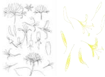
Gambar 3. pencarian modul melalui pendekatan stilasi