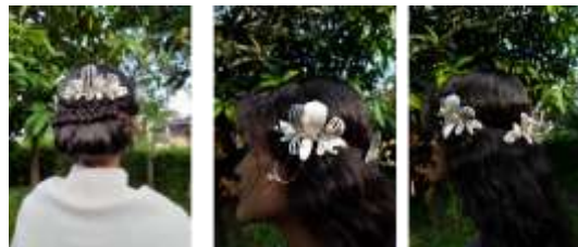
Gambar 7. Hasil mockup

Hasil dari proses desain kemudian dilanjutkan ke proses mockup . Mockup dilakukan dengan bahan yang mendekati bahan asil dari perhiasan, dilakukan untuk memastikan ukuran dan tampilan sehingga mengurangi resiko adanya kesalahan ketika produk dibuat dengan material dan ukuran sebenarnya. Setelah mockup dilakukan, lalu dibuat prototipe dengan material sesungguhnya yaitu logam kuningan dan bahan pelengkap lainnya.