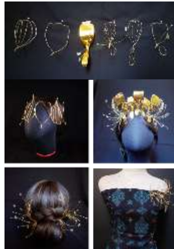
Gambar 4. Hasil Pengembangan Modul melalui pendekatan design by doing

Hasil dari pengembangan modul kemudian dianalisis lebih lanjut dan dipilih sesuai dengan kriteria dan batasan desain untuk dikembangkan secara lebih detail untuk rencana prototipe akhir. Kriteria pertimbangan pemilihan desain alternatif terpilih diantaranya adalah tipe perhiasan harus standout , mudah digunakan, ukuran yang adjustable . Dengan pertimbangan kriteria tersebut, perhiasan dibagian kepala merupakan tepat dilakukan sebagai pusat perhatian.