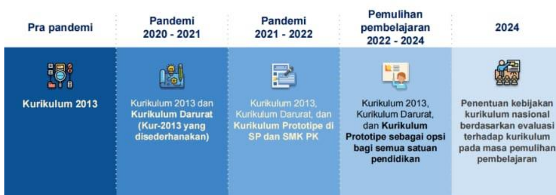
Gambar 1: Perkembangan Kurikulum 2022 (Degets, 2021)

Dalam perkembangannya, kurikulum 2022 ini sudah dimulai sejak prapandemi sebagai bentuk evaluasi terhadap kurikulum 2013, dan nantinya akan berakhir pada tahun 2024 jika kurikulum ini tidak memberikan dampak positif yang lebih baik dari kurikulum-kurikulum sebelumnya pada sistem pendidikan di Indonesia.