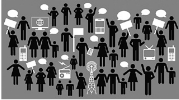
Figura 1. La libertad de expresión en la sociedad digital son las capacidades que tienen los individuos para elegir y exponer ideas según sus voluntades y, a la vez, poder acceder a la información disponible en las plataformas virtuales, (Fuente: https://indalics.com/blog-peritaje-informatico/libertad-de-expresion-en-internet )

La sociedad red aceleró su desarrollo con la pandemia y sus medidas de encierro de las poblaciones, prácticamente se ha duplicado el uso de internet en el mundo, en un 80% (Ramonet, 2020), permitiendo que las oficinas, escuelas, tribunales, iglesias y sectores importantes de la economía sigan funcionando. También la crisis del COVID-19 revela los riesgos para la sociedad, acelerando la transformación de las nuevas tecnologías en herramientas de vigilancia, seguimiento y control en manos del Estado, de las élites y de las grandes empresas de internet que ponen en peligro la privacidad y la libertad de expresión de la ciudadanía. En el siglo XXI estamos asistiendo a la constitución de un patrón moderno digital que transfigura absolutamente la manera de vivir, la comunicación y la libertad de expresión.