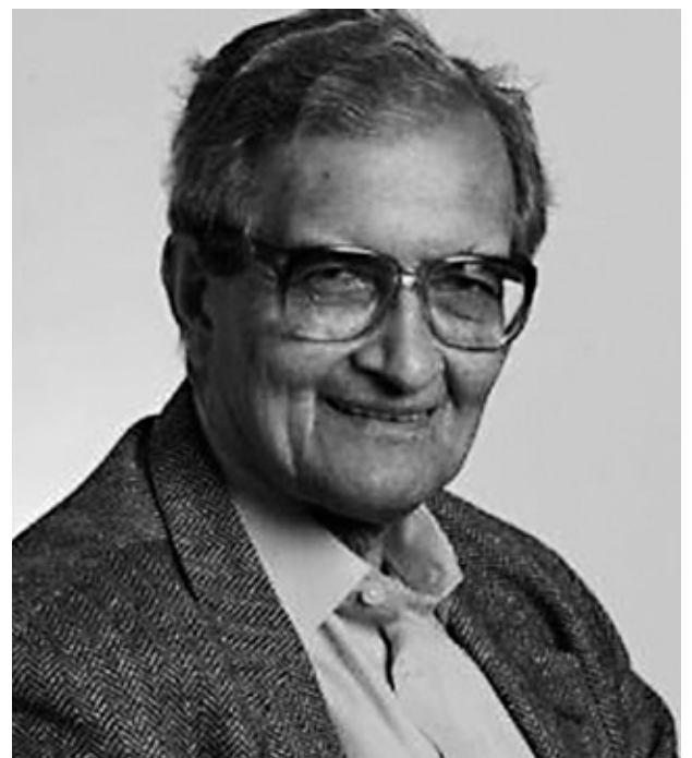
Figura 2. Para Amartya Sen.

Precisamente, la difusión de Internet ha transformando radicalmente la libertad de expresión en un sistema