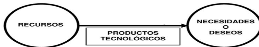
Figura 1 Proceso tecnológico