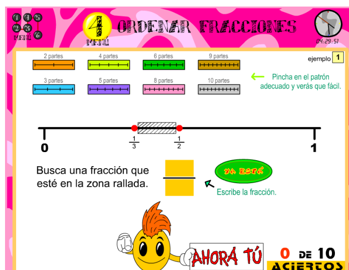
Figura 2. Primera pantalla del applet "Busca la fracción" (Menú 4)

Indicaciones. El esquema de este applet es similar al anterior. En la pantalla se muestra un segmento de recta con dos fracciones representadas, tanto con puntos en el segmento unidad, como en forma simbólica, y la indicación "busca una fracción que esté en la zona rayada" (ver la Figura 2).