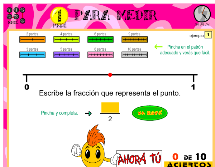
Figura 1. Primera imagen en la pantalla del applet Escalas (Menú 1)

la opción de seguir con otro ejercicio. Pero si el resultado es erróneo, aparecen la frase “no es correcto” y un botón con la opción de revisar, en el cual se muestra la respuesta correcta. Una vez consultada la respuesta se puede elegir otro ejercicio.