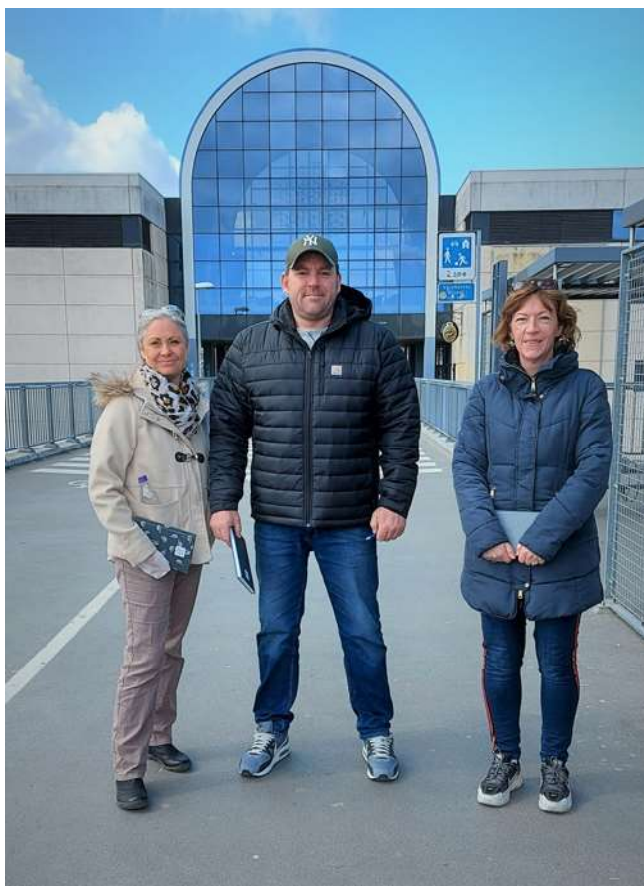
Deltagerne på den første soundwalk i april 2021 ved broen over togskinnerne ved Hundige Station.