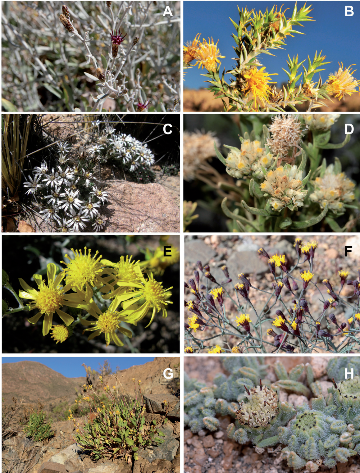
FIGURA 3. Especies endémicas de Asteraceae presentes en la Región de Arica y Parinacota. A) Aphyllocladus denticulatus var. calvus , B) Chuquiraga kuschelii , C) Oriastrum tarapacensis , D) Pseudognaphalium munozaiae , E) Senecio behnii , F) Senecio ctenophyllus , G) Senecio coscayanus , H) Senecio laucanus .